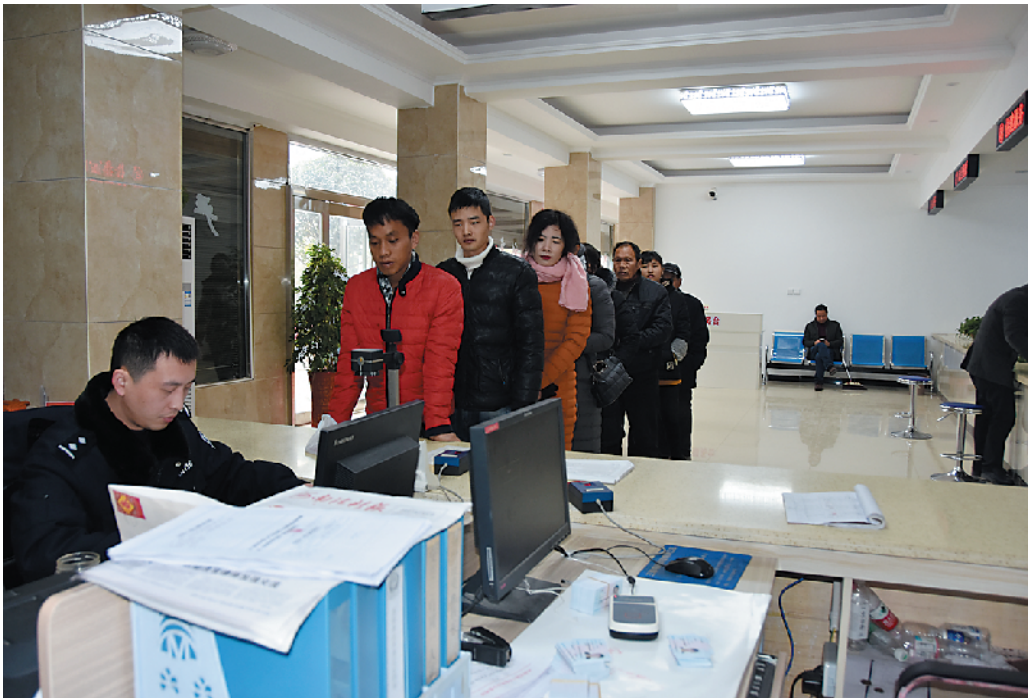
派出所户籍窗口是各镇办群众工作综合服务中心接待人数最多的窗口。图为南顿镇群众在户籍窗口排队办理业务。