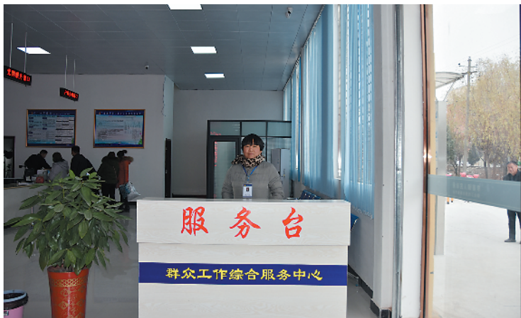
各镇办群众工作综合服务中心都设立了服务台,引导群众去有关窗口办理业务。