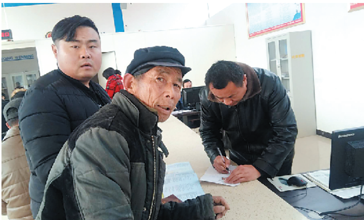
付集镇农民在群众工作综合服务中心农业窗口办理业务。