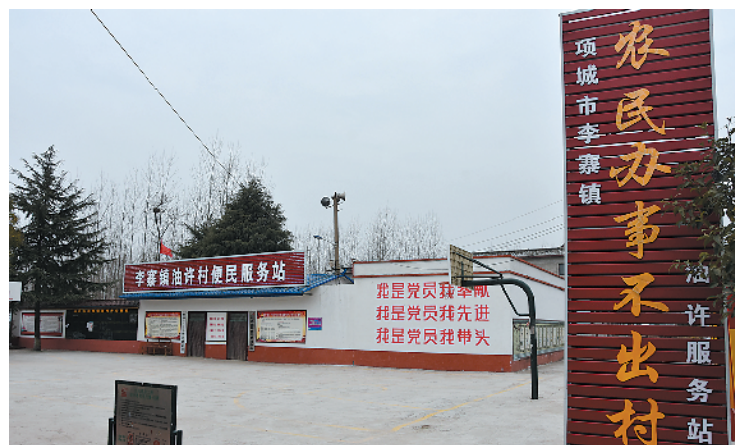
李寨、林陵等镇和水寨、花园等办事处建成了村级便民服务站。