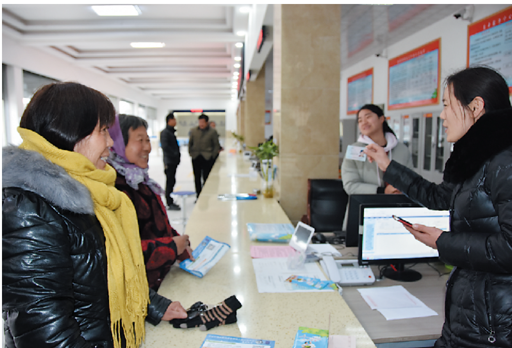
社保窗口也是各镇办群众工作综合服务中心接待量较多的窗口。这是东方办事处社保窗口工作人员在向群众演示养老金领取手机认证。