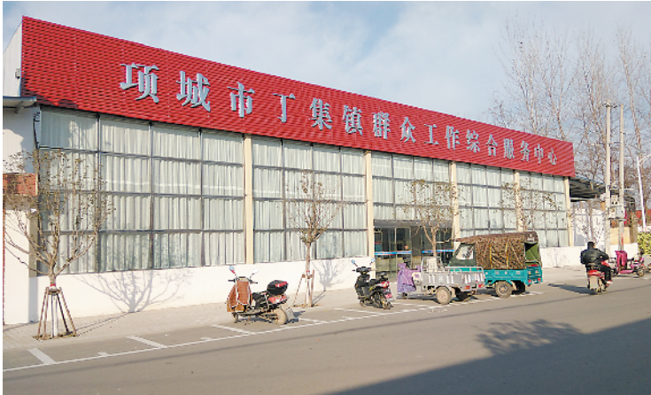
丁集镇群众工作综合服务中心