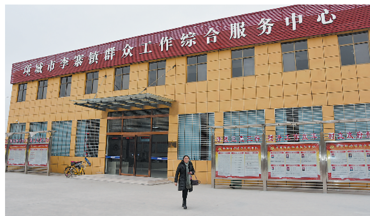
李寨镇群众工作综合服务中心