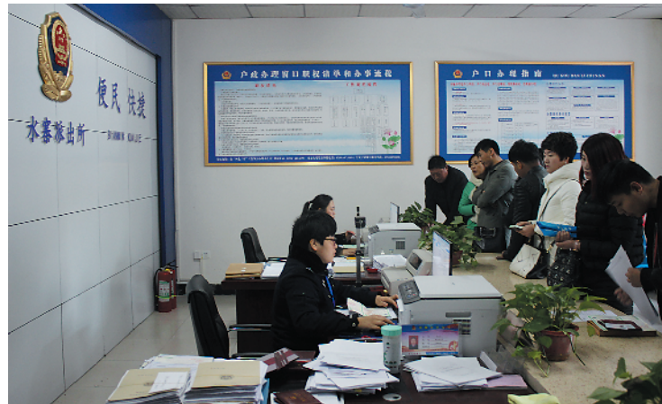
2017年12月13日8时,水寨办事处群众工作综合服务中心户籍窗口前围满了办事群众。