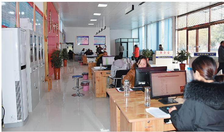
各镇办新建或改造了群众工作综合服务中心,宽敞明亮、设施齐全的大厅赏心悦目。

为总结推广项城经验,本报推出项城市部分镇办群众工作综合服务中心掠影,读者可以窥一斑而知全豹。