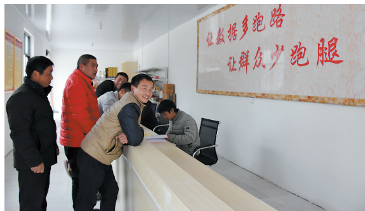
在村级便民服务站里,实现了“让数据多跑路、让群众少跑腿”。