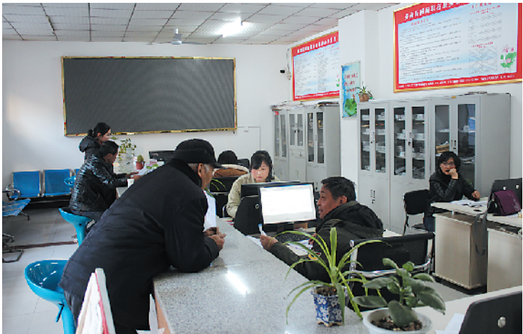
水寨办事处市民在群众工作综合服务中心住建窗口办理业务。