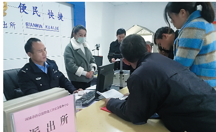
2017年12月15日17时30分,孙店镇群众工作综合服务中心户籍窗口前仍围满了办事群众。