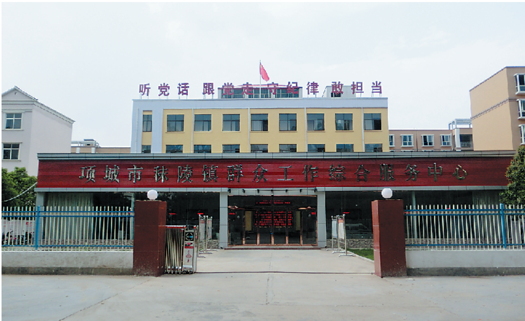
林陵镇群众工作综合服务中心