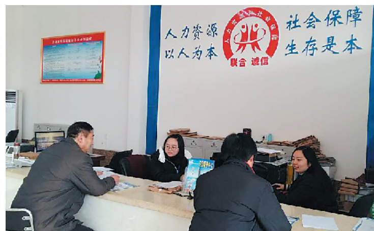
林陵镇农民在群众工作综合服务中心社保窗口办理业务。