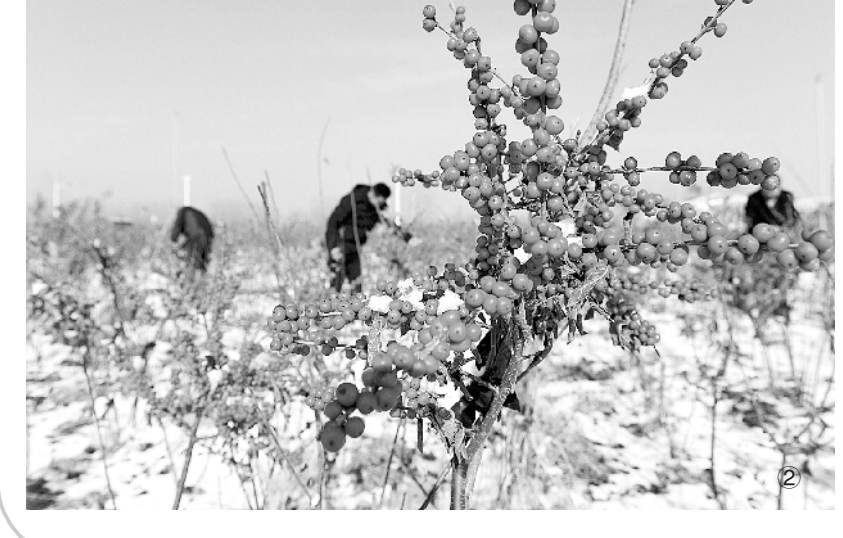
图①花卉小镇里鲜花艳 1月5日,河北省昌黎县杏树园村一位花农在大棚内管理花卉。近年来,河北省昌黎县杏树园村结合本村地理环境优势,发展大棚花卉种植业,取得了良好的经济效益。