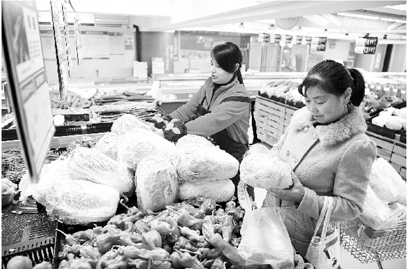
合肥:雨雪天气“惠民菜”投放市场 1月6日,市民在合肥市包河区金寨南路社区一家超市选购“惠民菜”。受持续雨雪天气影响,安徽省合肥市近期蔬菜价格涨幅较大。为了稳定市场价格水平,合肥决定从1月6日至1月12日启动合肥市惠民“菜篮子”工程活动,合肥市210家门店将提供20个规定品种的“惠民菜”,以市场平均价为基准,蔬菜类下浮15%以上,其他品种下浮5%以上。

截至2017年底,河南1157个贫困自然村实现4G网络覆盖,沈丘等6个贫困县138个贫困自然村光纤接入覆盖任务圆满完成。同时,河南积极推进贫困村电商帮扶试点工作,目前已确定电商帮扶试点贫困村1516个,确定电商帮扶对象6009户。