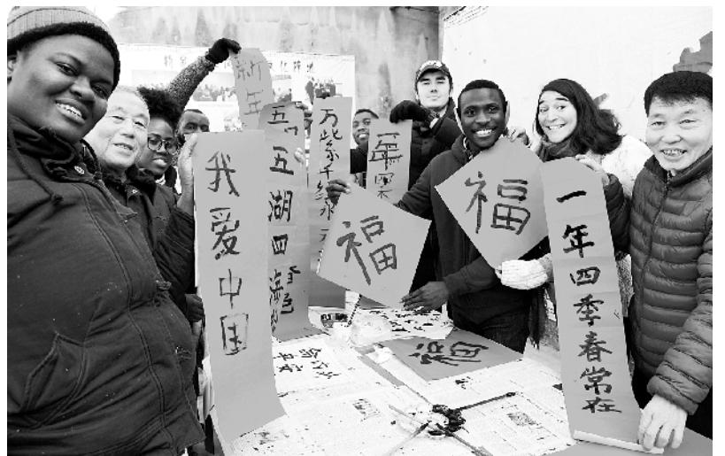
江苏镇江:留学生学写春联 感受传统文化魅力 1月14日,在江苏省镇江市金山街道杨家门社区,外国留学生和社区居民一同展示春联和福字。当日,江苏大学来自荷兰、加纳、塔吉克斯坦、牙买加等国的留学生走进镇江市杨家门社区,在书法家的指导下学写春联和福字,感受中国传统文化的魅力。

中国农业品牌创新联盟由中国农产品市场协会、中国农村杂志社联合发起成立,国内大型农业企业集团、金融机构、涉农科研单位以及相关社会团体组成。