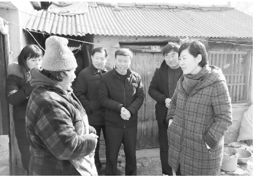
县委书记罗文阁在钱店镇贫困户家中听民声、访民情

脱贫攻坚战是一场全社会参与,需要全国各地尽锐出战、精准施策,对中华民族、对整个人类都具有重大意义的伟业。