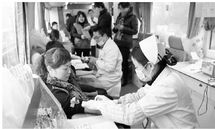
无偿献血 奉献爱心 1月17日,安徽省合肥市常青街道志愿者在流动献血车上献血。近日,安徽省合肥市中心血站部分

本次调查显示,职工队伍年龄整体出现小幅增长,平均年龄为37.1岁。“70后”“80后”仍是职工队伍主体,两者合计达66.9%。“90后”职工大幅增加,已占职工队伍的16.6%。“00后”也逐渐进入职工队伍。城镇职工平均年龄38.8岁,农民工平均年龄34.1岁,职工队伍年龄结构处于合理区间。