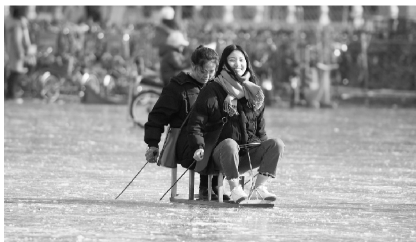
全民健身——冰上运动快乐多 1月17日,游客在北京什刹海冰场滑冰。近日,北京什刹海等冰场相继开

河南工商系统2017年立案查处不正当竞争案件4285件;查处假冒侵权案件1575件、广告违法案件1686件、不合格农资商品案件3060件、违法合同案件319件;捣毁传销窝点130个,教育遣返传销人员1467人,查处的“爱生活融e购”特大网络传销案,一举抓获涉案人员36人,查扣冻结涉案资金2.1亿元。