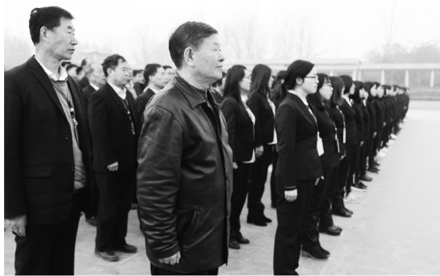
周口高中团结向上、勇于开拓的校领导及教师团队。(资料图片)

第三是后勤工作。后勤处本着“一切都以高中部筹建工作为中心”的原则,所有参与的教职工都全力支持高中部的工