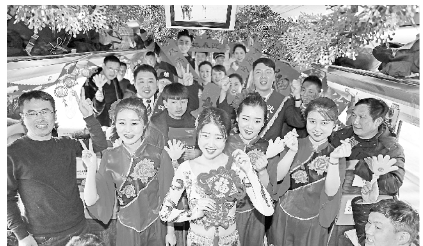
“高铁联欢”温暖回家路 2月8日,在G1226次列车上,“高铁联欢”的表演人员和旅客一起过新年。本次联欢会的7个节目全部由乘务员们自编自演,包括舞蹈、独唱、乐器演奏等,高铁乘务员还给旅客送上了春联和福字,让旅客们度过一个欢乐祥和的小年。 新华社发

河南省交通运输厅厅长张琼说:“河南省已经将‘四好农村路’建设工作列入2018年的10件实事,河南将继续努力把农村公路建好、管好、护好、运营好。”