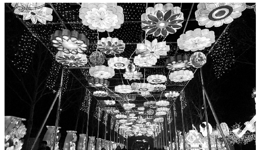
山东淄博:花灯璀璨迎新 花灯艺术节上,各种花灯琳琅满目。2月7日晚,2018年中国淄博花灯艺术节在山东省淄博市张店区玉黛湖景区开幕。据悉,本次花灯艺术节展出大型花灯77组,将持续举办到3月18日。