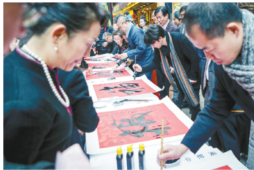
翰墨飘香 情系中华——在日华人书法家们在横滨中华街迎春送福

据中国驻俄罗斯大使馆领事部向俄紧急情况部了解,目前从失事客机的乘客名单来看,该飞机上没有中国乘客。这架属于俄罗斯萨拉托夫航空公司的安-148客机当天计划从莫斯科前往俄西南部城市奥尔斯科,客机起飞后不久在莫斯科市东南方向距机场约35公里的斯捷潘诺夫斯科耶村附近坠毁。