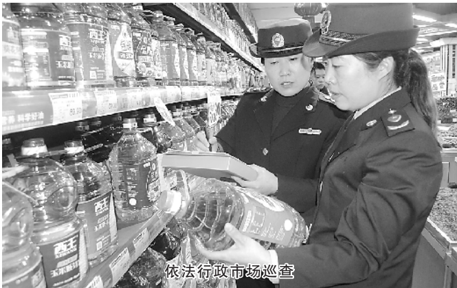
依法行政市场巡查

回顾成绩坚定信心，展望未来凝聚力量。2018 年，太康县工商局将在太康县委、县政府和周口市工商局的正确领导下，认真贯彻落实党的十九大精神，以习近平新时代中国特色社会主义思想为指导，纵深推进商事制度改革，全面推动市场监管改革创新，着力抓好“证照分离”改革、“双随机、一公开”监管、消费维权、商标品牌战略、全县燃煤散烧治理和脱贫攻坚等工作，努力营造更加宽松便捷的市场准入环境、更加公平有序的市场竞争环境、更加安全放心的市场消费环境，为促进太康全县高质量发展做出新的更大贡献。①6