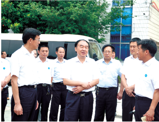
河南省人大常委会副主任徐济超莅临学校调研