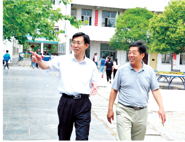
县委书记马明超到学校视察指导工作