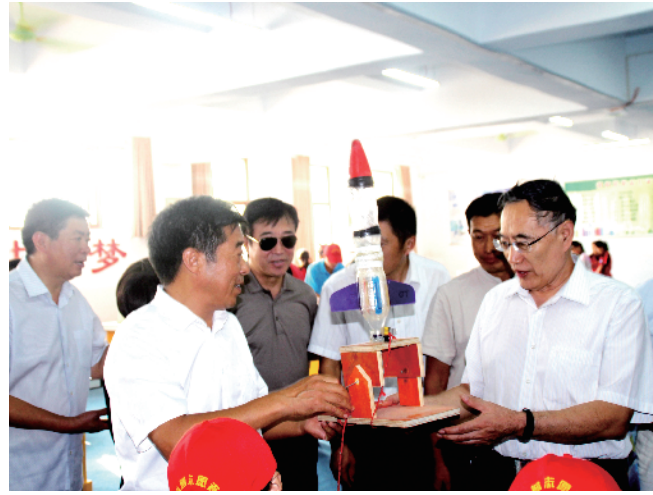
全国政协人口资源环境委员会副主任齐让莅校调研科技馆运行情况