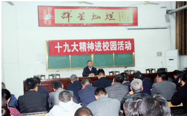
学习十九大精神报告会