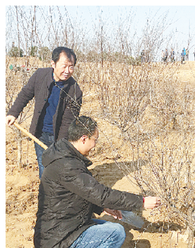
上图 3 月 12 日,市科技局迅速响应市委、市政府号召,积极开展植树造林活动。

左图 昨日,我市组织社会各界 1600 多名植树护绿志愿者,来到新建的周口市森林公园参加义务植树活动,助力我市创建全国绿化模范城市。