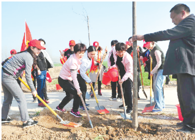
左图 昨日上午,鹿邑县义务植树活动如火如荼开展。植树节来临,该县组织社会各界人士积极开展植树造林活动,为建设“绿色鹿邑”贡献力量。

左图 昨日,我市组织社会各界 1600 多名植树护绿志愿者,来到新建的周口市森林公园参加义务植树活动,助力我市创建全国绿化模范城市。