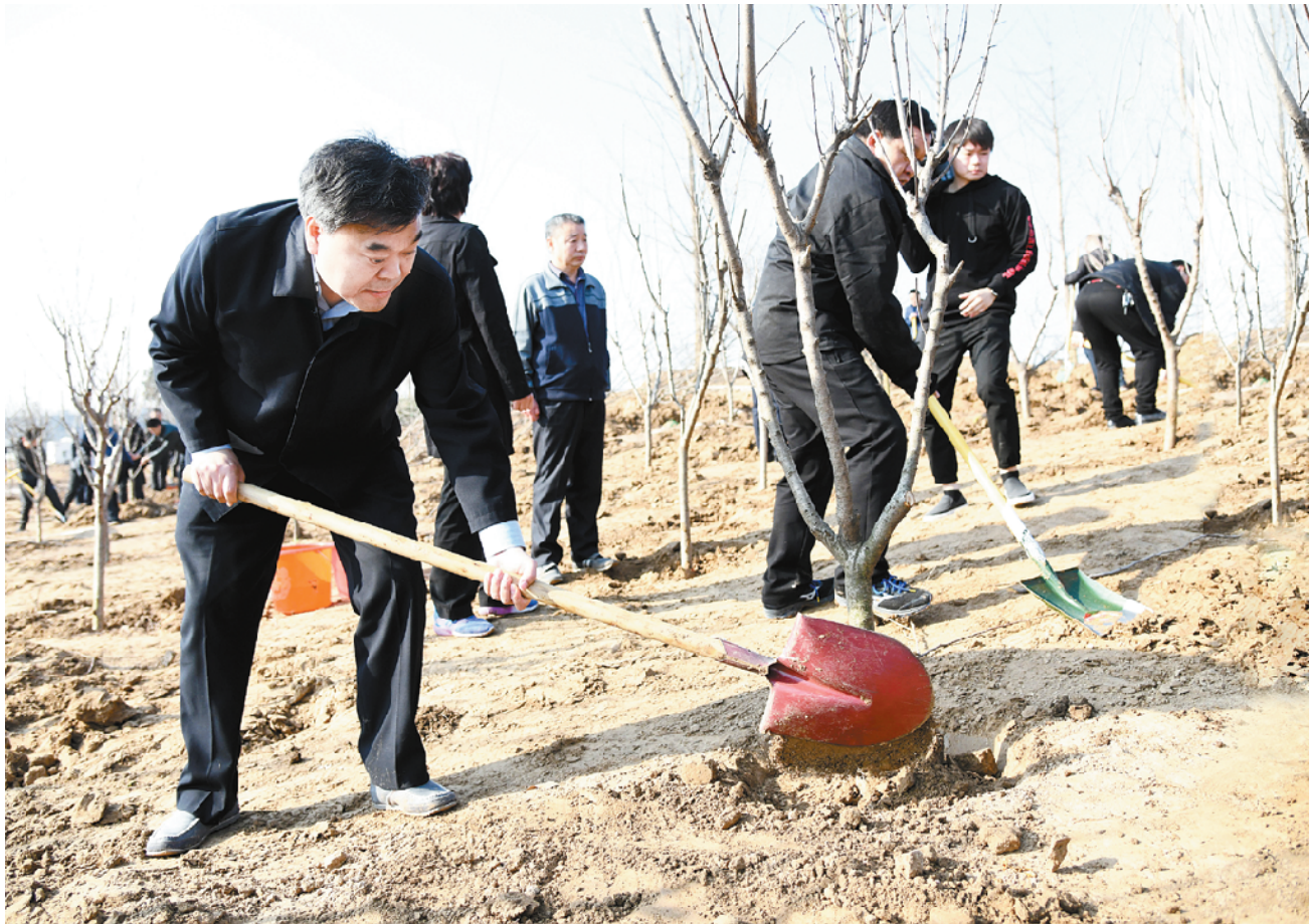
3 月 12 日上午,市委书记、市人大常委会主任刘继标等市领导在周口市森林公园,与干部群众一起义务植树。

植树间隙,刘继标听取了市林业局负责人关于我市植树造林情况和市森林公园建设情况的汇报。刘继标指出,今年是周口城市建设非常关键的一年,我们要站在发展城市森林、打造现代生态城