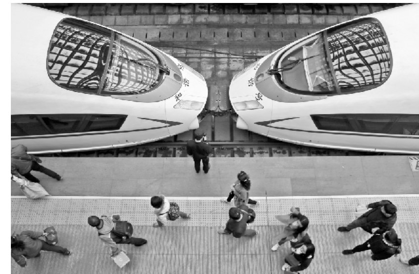
4月10日起全国铁路实行新列车运行图。4月9日，旅客在山东烟台火车站下车出站。4月10日0时起，全国铁路将实施新的列车运行图。运行图调整后，“复兴号”动车组开行数量增加，货运能力进一步提升。

分区域看，今年一季度，东、中、西部地区财政收入分别增长8.6%、10.2%、9.1%，其中税收收入同比分别增长11.6%、20.2%、18.9%，比去年同期分别加快1.2个、4.1个、2.8个百分点。