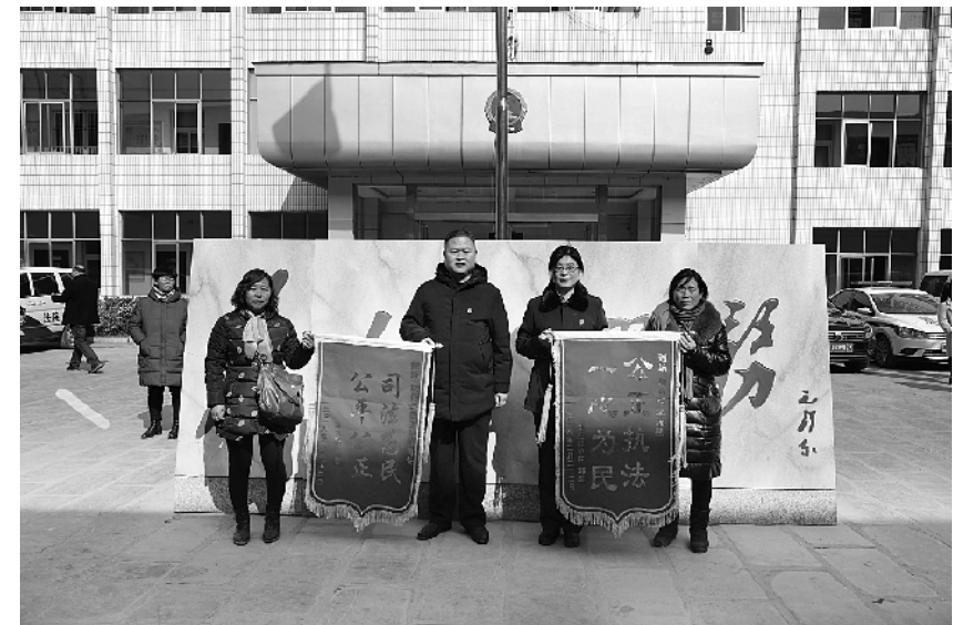
申请人为执行法官送锦旗。

“工欲善其事,必先利其器”,该院与三大网络通讯公司共建信息查询、被执行人查找、失信被执行人电话彩铃定制等业务,执行法官通过网络通讯平台查询失信被执行人的信息、通话记录等。同时,在全市率先成立执行指挥中心,将执行指挥中心下设案件分配组、案件送达组、案件查控组、司法网络拍卖组、一案一账户及执行指挥管理平台组等6个案件办理组,充分利用指挥中