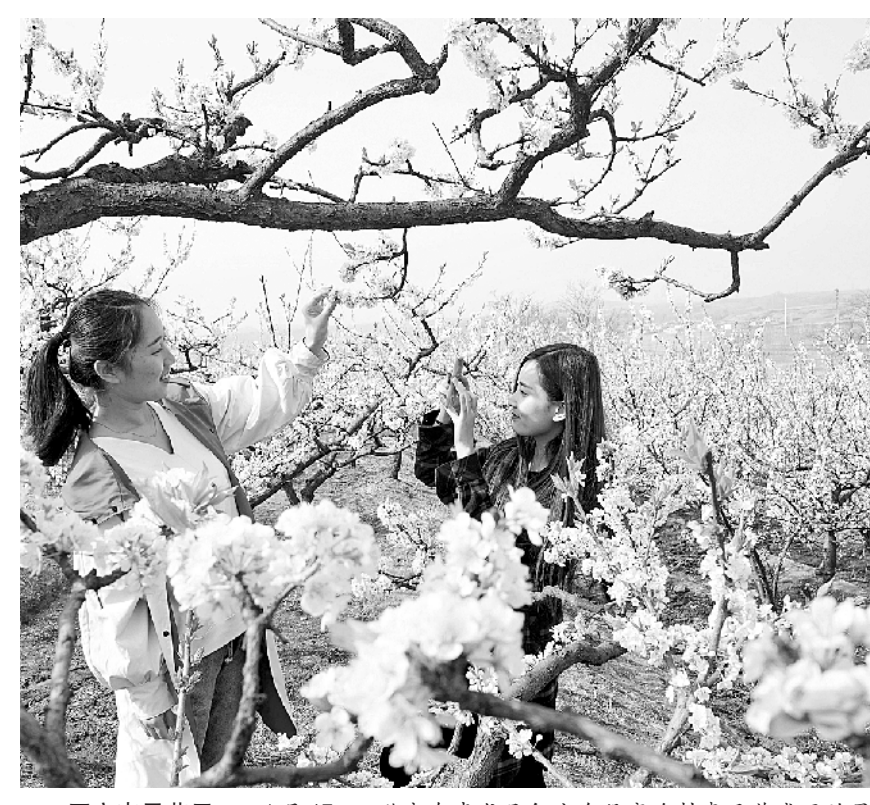
万亩李子花开 4月17日,游客在卢龙县印庄乡段家沟村李子花盛开的果园内拍照。近日,河北省卢龙县的一万多亩李子花竞相绽放,呈现出了一幅美丽画卷。