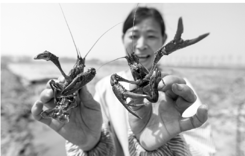
江苏宿迁:藕“遇”小龙虾 富民大产业 4 月 18 日,在江苏省宿迁市中杨集镇周荷塘种植专业合作社,当地村民展示收获的小龙虾。近年来,江苏省宿迁市中杨镇发挥当地专业合作社的带动作用,发展特色水产养殖项目,进行万亩浅水藕套养小龙虾,采取“合作社+基地+农户”模式,亩均年收益超过 6000 元,成为富民增收、精准扶贫的特色产业,带动当地 1200 余户农民增收致富。

迁坟公告 金海嘉苑安置区建设工程项目是川汇区棚户区改造征迁工程指挥部的民生工程,功在当代,利在千秋。因工程建设需要,需迁移该项目建设征地范围内的坟墓,现将有关事项公告如下: 一、迁坟范围:周西路以东,调水渠以南区域征地范围内的坟墓。 二、迁坟期限:自公告发布之日起到 2018 年 4 月 25 日止。 三、迁坟要求:自公告发布之日起,请上述规划征地范围内的坟主亲属尽快到当地村委会办理迁坟手续和补偿事宜,在规定的时间内将坟迁移。逾期未迁的,将视为无主坟由村委会统一迁移。 四、联系人:刘 涛 13903949280 特此公告 周口市川汇区棚户区改造征迁工作第二指挥部 2018 年 4 月 19 日