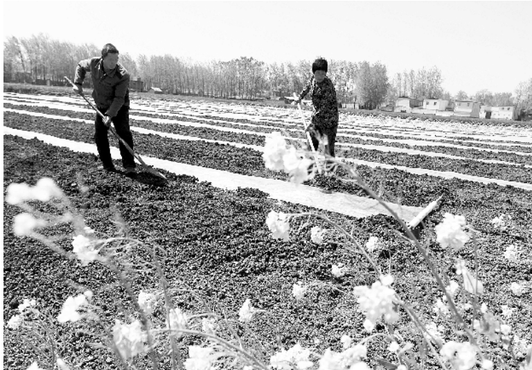
日前，商水县袁老乡马河村群众在忙着覆膜，为西瓜苗移栽做准备。春耕时节，该县积极组织农业技术人员深入田间地头，指导农民抢抓农时进行春耕，抢墒栽种西瓜、烟叶等经济作物。