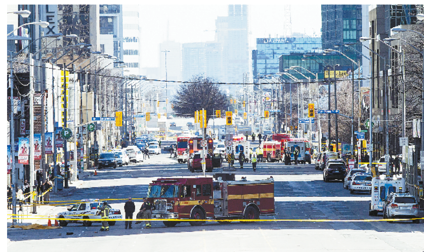
加拿大汽车撞人事件造成9死16伤 这是4月23日在加拿大多伦多拍摄的汽车撞人事件现场。加拿大多伦多警方23日说,当天下午该市发生的汽车撞人事件已造成9人死亡、16人受伤。多伦多市代理警察局长当天在新闻发布会上说,肇事男子已被捕,多伦多警方正在全力调查此事,但目前尚不清楚肇事动机。