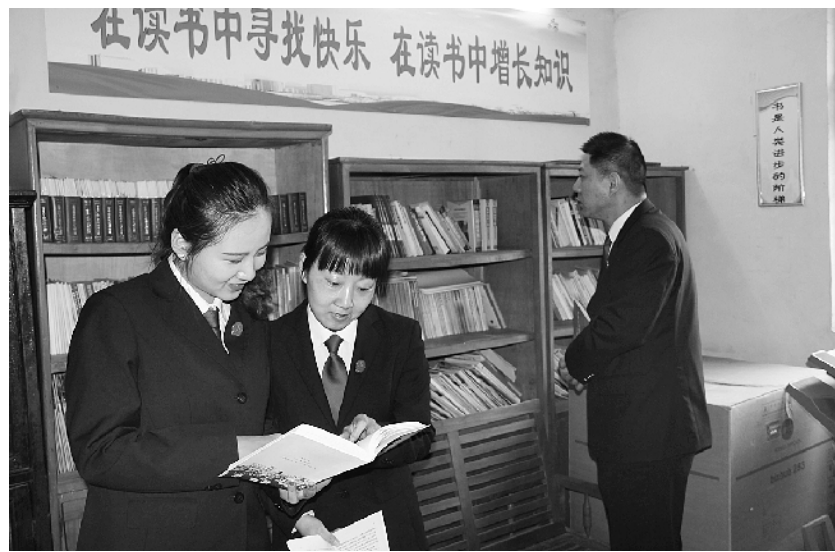
春风十里不如你,一路书香遇见你。为激发干警学习热情,推进法院文化建设,近日,扶沟县人民法院通过组织干警开展“全民阅读”活动,全力打造书香型、学习型法院。

构信用评估机制,与鉴定评估机构的等级管理制度挂钩,确保评估结果客观公正。 对于川汇区人民法院提出的鉴定评估管理细则,各鉴定评估机构纷纷表示肯定和支持,并表示将进一步规范自我管理,定期与川汇区人民法院进行沟通,全力配合各项鉴定评估工作开展。