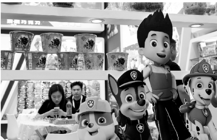
第十九届中国国际食品和饮料展览会开幕 5 月 16 日拍摄的展览会上展出的儿童食品。当日, 第十九届中国国际食品和饮料展览会在上海开幕。本届展览会设立酒及高端饮品、休闲食品、功能性营养食品、生鲜冷链等展区, 吸引国内外的 3000 多家展商参加。

公安、城管执法等多部门下沉到街道、乡镇, 开展“点穴式”联合执法, 旨在“把脉问诊”, 帮助街道、乡镇分析影响空气质量的原因, 也聚焦“攻坚点穴”, 集中执法力量, 严厉查处污染大气环境的违法行为, 形成震慑。