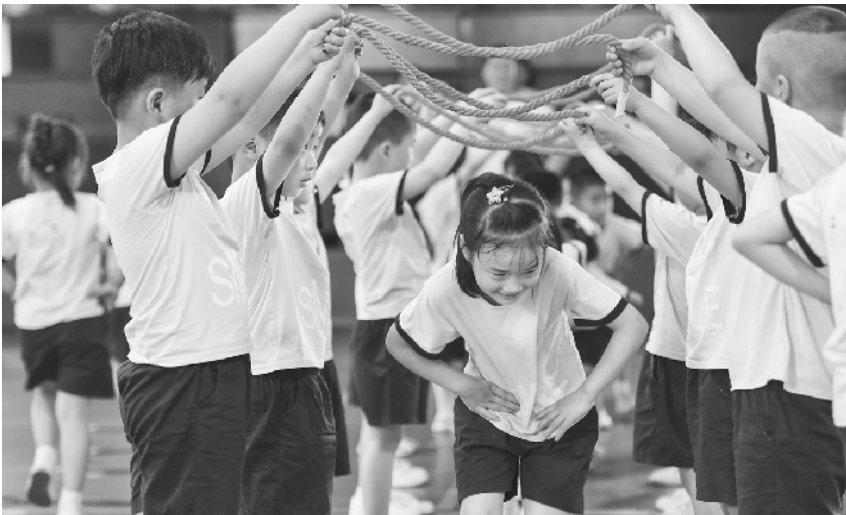
我运动 我快乐 5 月 16 日, 舒城县城关幼儿园大一班的小朋友们在进行《闯关》表演。当日, 安徽省舒城县城关幼儿园 26 个班级的近 900 名孩子进行了一场运动与创意相融合的早操表演比赛, 在运动中享受快乐。

中央气象台预计, 未来 3 天, 江汉、江南中东部及华南东部等地部分地区有 35℃以上的高温天气, 局地最高气温将达 37℃以上。气象专家提醒浙江、福建、重庆等地民众防范高温影响, 做好防暑准备。