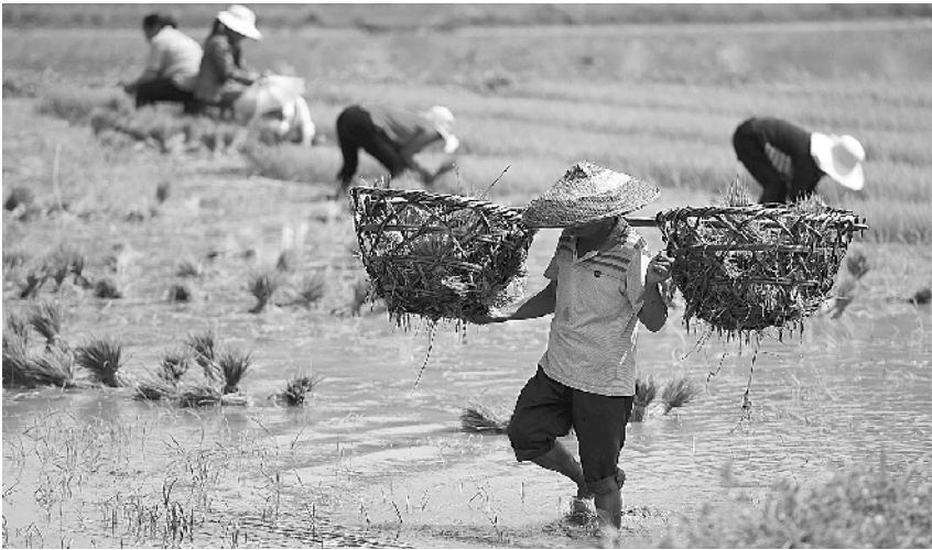
黔北打田插秧忙 5 月 16 日, 在贵州省遵义市余庆县大乌江镇凉风村, 农民在田间劳作。小满将至, 气温升高、雨水渐多, 贵州省遵义市余庆县的农民抢抓农时打田插秧, 为收获季打下基础。

据中国农科院油料所介绍, 我国三熟制油菜品种普遍存在产量低等瓶颈问题, “阳光 131”品种选育缩短了生长期, 比一般三熟制油菜品种早熟和高产。