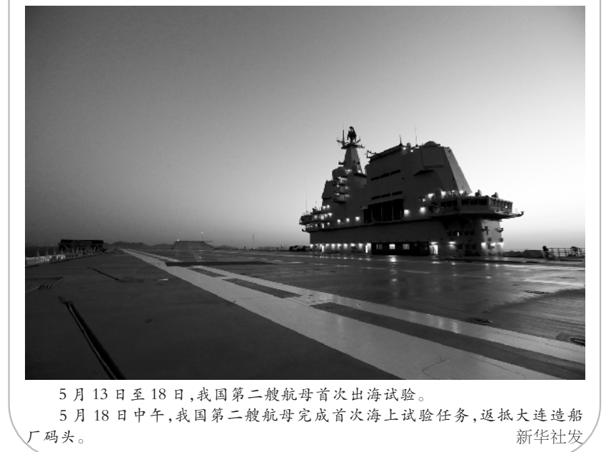
5 月 13 日至 18 日，我国第二艘航母首次出海试验。 5 月 18 日中午，我国第二艘航母完成首次海上试验任务，返抵大连造船厂码头。

标题新闻 ●国际公路运输系统正式在中国落地实施 ●我国“复兴号”动车组中国标准超八成 ●“向阳红 01”完成中国首次环球海洋综合科考凯旋 ●交通运输部：推动取消高速公路省界收费站 ●央行进一步完善跨境资金流动管理 ●最高人民法院顾维军案再审合议庭召开庭前会议（均据新华社电）