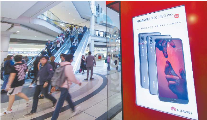
加拿大运营商开售华为P20系列智能手机 5月17日,在加拿大多伦多伊顿购物中心,人们从华为P20系列智能手机广告旁经过。包括罗杰斯、贝尔与特勒斯等在内的加拿大主要电信运营商17日开始发售最新款华为P20系列智能手机。

中国驻缅甸大使洪亮说,中国—东盟博览会已成功举办了14届,已成为促进中国与东盟友好交流、经贸往来及多领域合作的重要平台。缅甸政府高度重视东博会,缅甸商务部把东博会列为每年重点支持的展会之一,缅甸国家领导人多次率团出席,工商界参展热情高涨,参展参会规模逐年扩大,取得了良好成效。