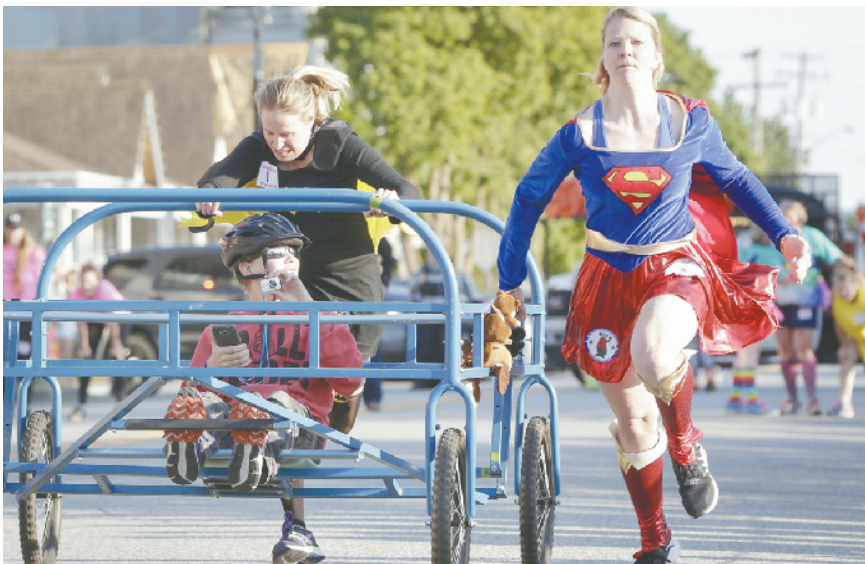
加拿大萨里市举行“推床跑”大赛 5月17日,在加拿大萨里市,选手推着“床车”在比赛中奔跑。当日,萨里市举行一年一度的“推床跑”大赛,选手们推着用床架改装的“床车”在街道上赛跑。

华沙图书展是中东欧地区规模最大的图书盛会之一。本届书展为期4天,来自32个国家的800多家参展商参展,期间还将组织1500场读者见面会和文学讨论会等活动。