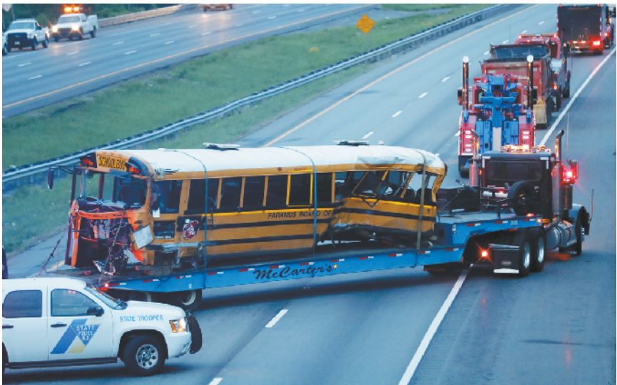
美国一校车与卡车相撞 5月17日,在美国新泽西州莫里斯县,发生撞车事故的校车被运离事发地。美国新泽西州州长墨菲17日说,该州当天发生一起校车与卡车相撞事故,事故造成至少一名教师和一名学生死亡,另有43人受伤。

据巴基斯坦媒体报道,当天早些时候,巴安全人员曾在奎达郊区发动突袭,打死3名恐怖分子,其中包括非法武装组织“无城军”在俾路支省的头目萨勒曼·巴德尼。