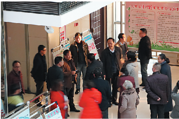
副市长张广东检查指导工作