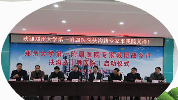
郑大一附院专家到扶沟县人民医院义诊