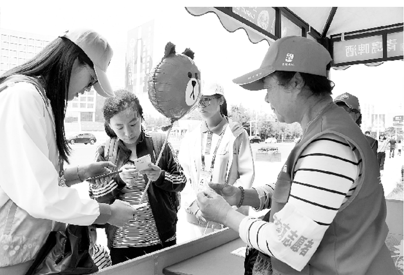
近 2 万名城市运行志愿者上岗服务上合青岛峰会 5 月 27 日，几名城市运行志愿者在街头为游客提供咨询服务。近日，来自青岛各行业的近 2 万名志愿者开始上岗，为 2018 上海合作组织青岛峰会会议提供城市运行志愿服务。