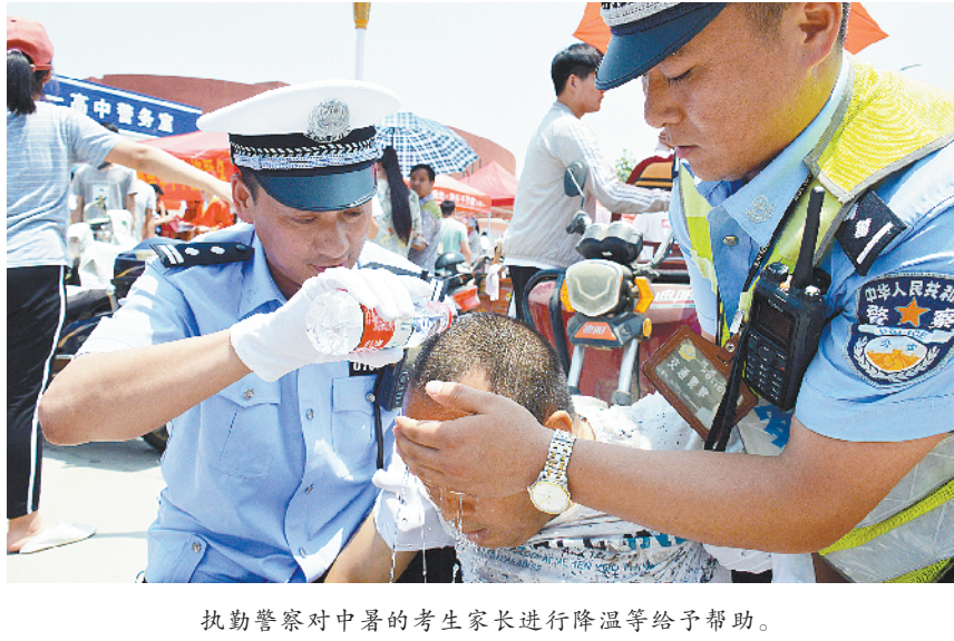
执勤警察对中暑的考生家长进行降温等给予帮助。

本报讯 (记者 韦伟 通讯员 李俊王鹏伟)沈丘县邢庄镇采取形式多样、创新活动内容,扎扎实实开展安全生产月宣传活动,全镇安全生产月活动有声有色,群众安全意识明显增强。 领导重视程度高。该镇成立了由镇长任组长,分管领导任副组长,交通、农业、教育、电力、民政等相关单位责任人员任成员的邢庄镇安全生产月活动领导小组。党政一把手靠前指挥,多次召开专题会,研究部署安全生产月活动开展情况,制定了《邢庄镇安全生产月活动方案》,做到领导过问、分管具体、措施落实不棚架。 宣传形式多样化。该镇通过层层召开会议,悬挂张贴宣传条幅,设立流动宣传栏,组织宣传车入村,安全法规进校园等形式,把安全生产的政策法规、责任主