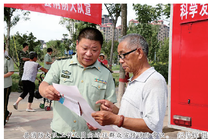
县消防大队工作人员向过往群众宣传消防常识。