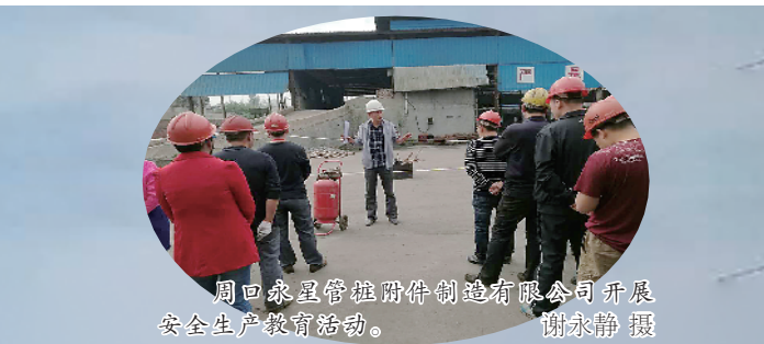
周回森管桩附件制造有限公司开展安全生产教育活动。