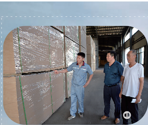
图①“安全生产月”期间,县安监局工作人员到河南豫人木业有限公司、河南鼎铝环保建材有限公司、扶沟中钢再生资源有限公司等企业检查安全生产工作。