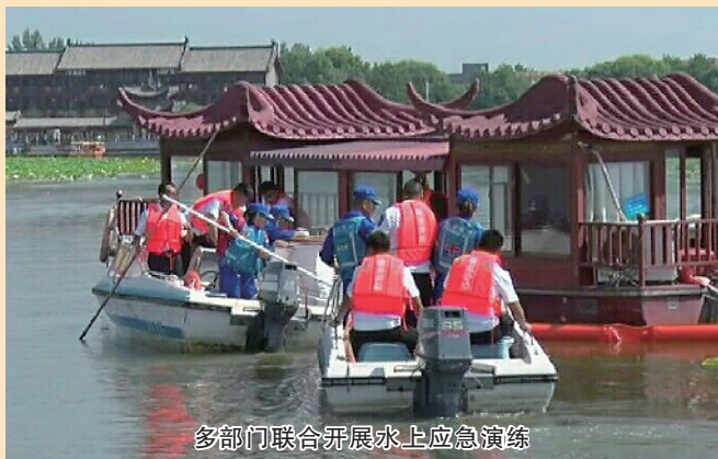
多部门联合开展水上应急演练