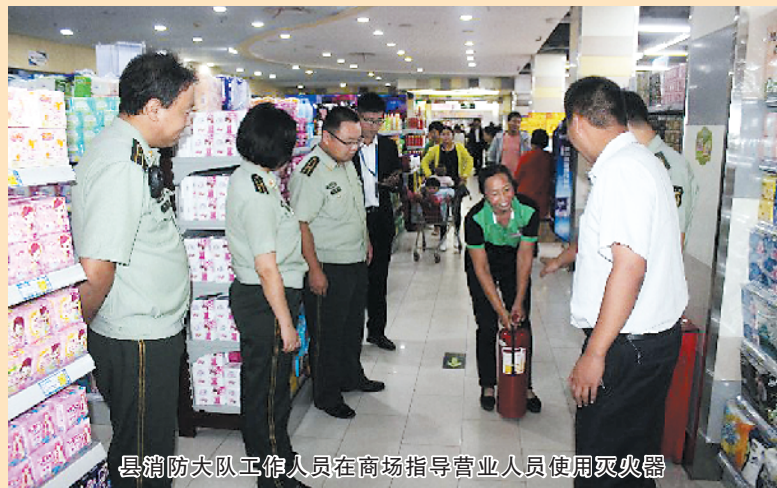
县消防大队工作人员在商场指导营业员使用灭火器

业集聚区管委会组织企业开展各种各样的安全生产应急演练,增强了企业职工自救互救能力。县住建、教体、旅游、消防等部门,安岭镇、冯塘乡、白楼镇、王店乡等乡镇分别组织不同形式的安全生产应急救援演练。全市安全生产综合应急救援演练(淮阳现场)正在积极筹备中。安全生产永远在路上。淮阳县将抓细、抓紧、抓实、抓好安全生产责任落实和安全生产各项工作,常抓不懈、持之以恒,消除安全生产隐患,防范安全生产事故发生,确保全县安全生产形势持续稳定。