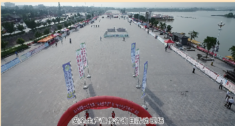
安全生产宣传咨询日活动现场