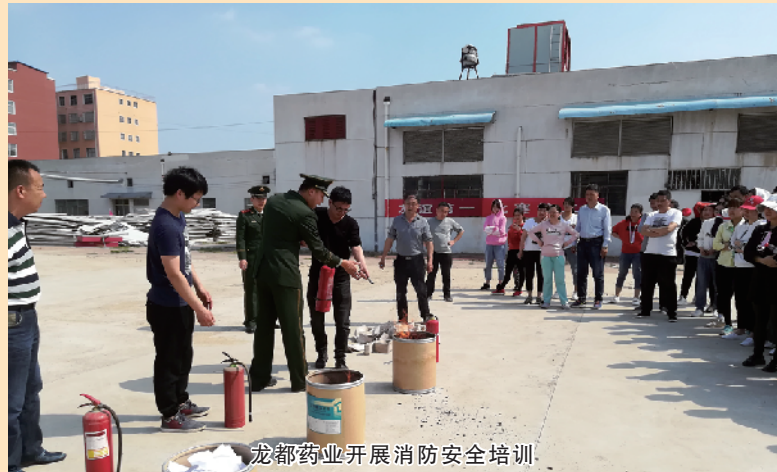
龙都药业开展消防安全培训