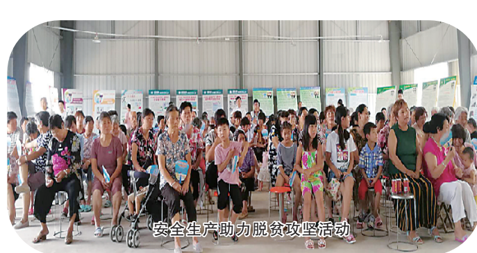
安全生产助力脱贫攻坚活动

我市将精准扶贫和精准脱贫与安全生产监管工作有机结合,找准安全监管与脱贫攻坚的结合点,补齐农村安全生产工作的短板,主动作为,开展扶贫攻坚大帮扶活动,走出了一条安全生产助力脱贫攻坚的创新之路。市安监局组织教育局、消防支队、周口电力公司、河南亿星公司等单位在结对帮扶村商水县姚集镇朱庄行政村举办安全生产助力脱贫攻坚宣传咨询活动,为贫困户送上夏季生活物品,组织播放安全生产录像,发放宣传资料,向村民讲解道路交通、消防、用气、用电、防溺水、农机安全等方面的安全知识。