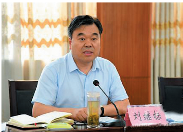
市委书记刘继标主持召开安全稳定工作专题会议