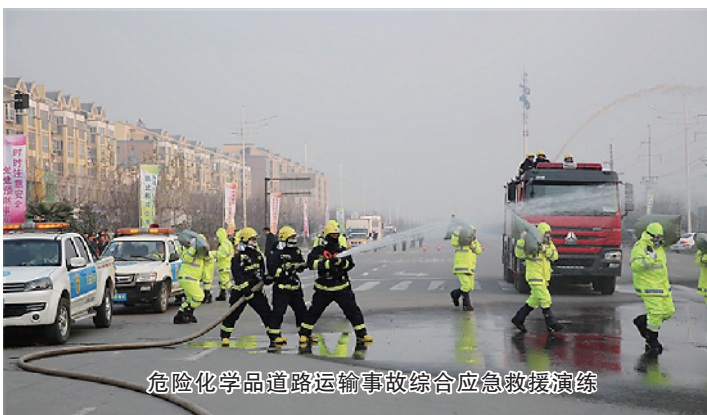
危险化学品道路运输事故综合应急救援演练

应急救援是有效控制事故、最大限度降低事故损失的重要环节。为提升应急救援部门的联动和快速反应能力,我市依托消防队伍,整合重点企业资源,加强应急救援体系建设,强化落实应急演练工作的属地责任、部门责任和企业主体责任,积极组织开展形式多样的应急救援大演练活动,实现了应急管理工作的常态化、制度化、规范化。2017年12月28日,市政府在西华县组织开展“危险化学品道路运输事故综合应急救援演练”现场观摩会,为全市应急救援演练拉开了序幕。今年以来,全市各类应急演练达3300多场次,出动消防车辆360多辆次,消防官兵1530多人次,进一步提高了应对突发安全事故的综合指挥能力、快速反应能力、应急处理能力、部门之间协同作战能力。