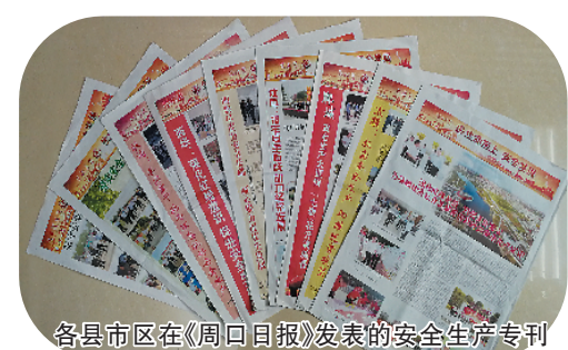
各县市区在《周口日报》发表的安全生产专刊