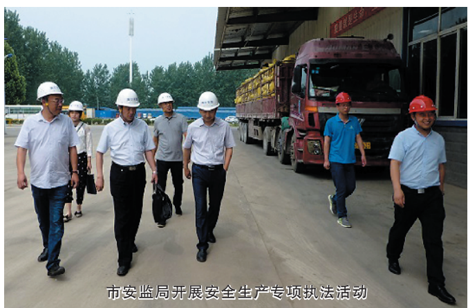
市安监局开展安全生产专项执法活动

始终坚持隐患就是事故的理念。持续深入开展重点行业、重点领域、重点部位安全隐患治理。交通运输领域严厉打击以包代管、违规挂靠、超载超速超员等违法行为,遏制道路交通事故多发势头。建筑施工领域突出抓好在建项目防触电、防坠落、防坍塌“三防”专项整治。危化品和烟花爆竹领域突出抓好夏季高温、汛期安全防护,持续开展综合治理,全面加强安全监管。消防领域突出抓好电动自行车消防安全、夏季火灾防控和电气火灾三项综合整治,严格火灾高危单位和人员密集场所检查整治,严防火灾事故发生。教育、旅游、电力、民政、农机等行业按照市委、市政府的统一部署,结合各自的行业特点,开展安全生产大检查,及时消除各类事故隐患。严格落实重大隐患挂牌督办制度,依法依规查处并曝光各类严重违法行为和安全生产事故,对严重违法失信行为实施联合惩戒和“黑名单”制度。