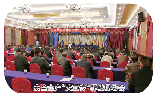
安全生产“大宣传”郸城现场会