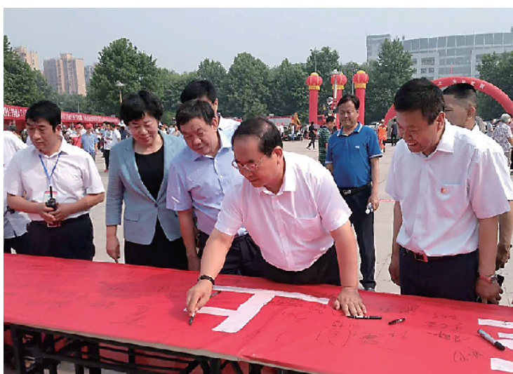
市长丁福浩参加安全生产月咨询日签名活动