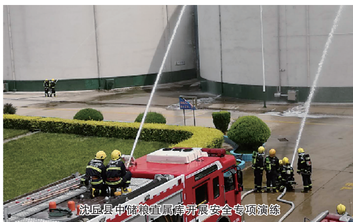
沈丘县中储粮直属库开展安全专项演练

应急救援是有效控制事故、最大限度降低事故损失的重要环节。为提升应急救援部门的联动和快速反应能力,我市依托消防队伍,整合重点企业资源,加强应急救援体系建设,强化落实应急演练工作的属地责任、部门责任和企业主体责任,积极组织开展形式多样的应急救援大演练活动,实现了应急管理工作的常态化、制度化、规范化。2017年12月28日,市政府在西华县组织开展“危险化学品道路运输事故综合应急救援演练”现场观摩会,为全市应急救援演练拉开了序幕。今年以来,全市各类应急演练达3300多场次,出动消防车辆360多辆次,消防官兵1530多人次,进一步提高了应对突发安全事故的综合指挥能力、快速反应能力、应急处理能力、部门之间协同作战能力。