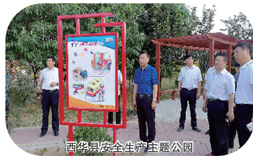
西华县安全生产主题公园

今年6月是第17个全国“安全生产月”,主题是“生命至上、安全发展”。市政府安委会制订了安全生产月宣传工作方案,明确提出安全宣传“十个一”总体要求,层层动员部署,组织安全生产事故警示教育、安全生产宣传咨询、应急演练、安全周口行、安全知识竞赛等系列活动。截至目前,全市共组织学习宣讲活动483场次,开展警示教育活动4399次,举办知识竞赛、演讲比赛等3000余次。咨询日当天,全市共出动宣传车144台次,布置展板1700余块,悬挂张贴横幅、标语2000多幅(条),发放宣传资料30多万份,在各类新闻媒体推送经验交流信息469条,全市形成了人人关注安全生产、人人参与安全生产、人人共享安全发展成果的良好氛围。