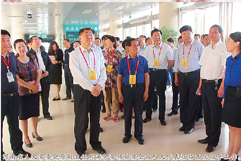
河南省人大常委会原副主任刘满仓带领驻豫全国人大代表在周口市妇幼保健院指导工作。