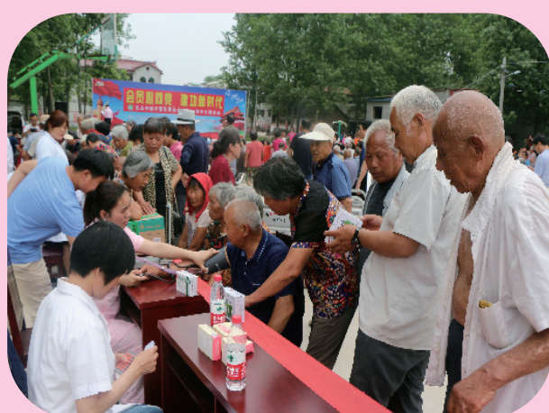
5月29日，在沈丘白集大滩李义诊所。