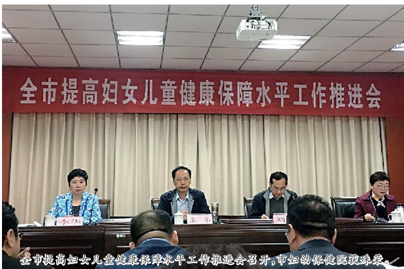
全市提高妇女儿童健康保障水平工作推进会召开，市妇幼保健院领导参加。

“让健康伴随每一位女性，让阳光洒向所有的孩子”，周口妇幼人践行着这一平凡而伟大的诺言。如今，周口市妇幼保健院(周口市儿童医院)已将健康促进项目纳入医院长期发展规划;将健康促进工作与医疗、预防、儿保及孕产妇保健等工作相结合;将“关爱生命，护佑健康”作为医院的服务理念，实现“以病人为中心”到“以人的健康为中心”服务模式的转变。通过健康促进工作使公众逐步实现“四个转变”:大病向小病转变;小病向无病转变;无病向健康转变;健康向长寿转变。实现公众从“胚胎到寿终”一生的健康管理目标，共同构建和谐、美好、稳定、健康的社会。