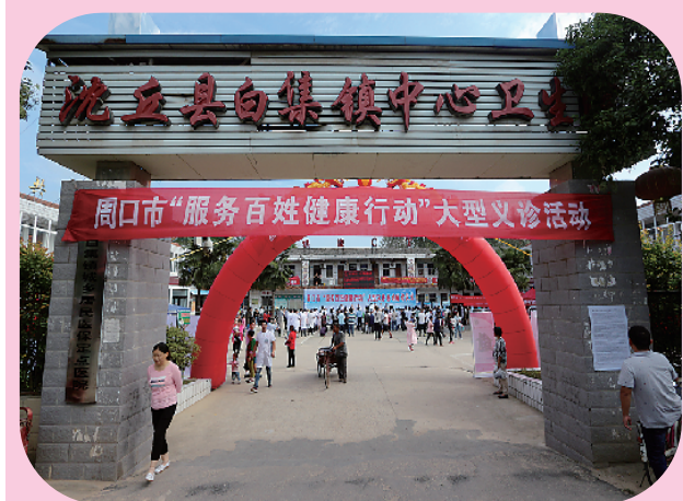
2017年9月15日，在沈丘白集卫生院开展义诊活动。