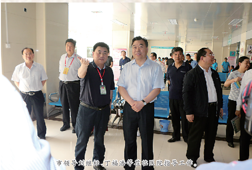
市领导刘继标、丁福浩等在周口市妇幼保健院指导工作。