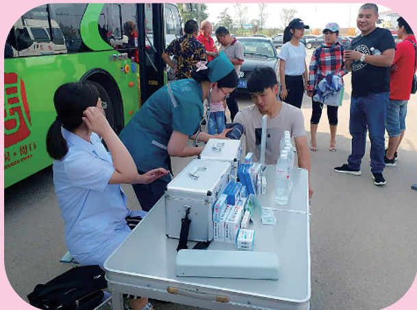
6月7日至8日，助力高考，让梦想扬帆起航。