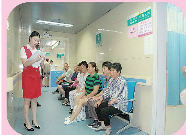
6月28日，东新区庆丰社区服务工作现场。