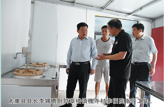
太康县县长李锡勇到符草楼镇槐寺村幸福院指导工作。