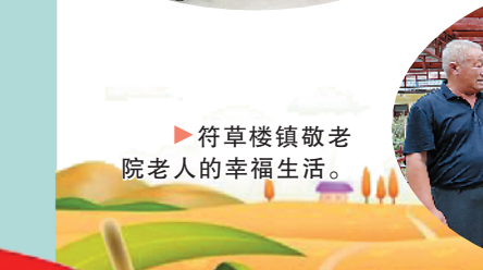
符草楼镇敬老院老人的幸福生活。