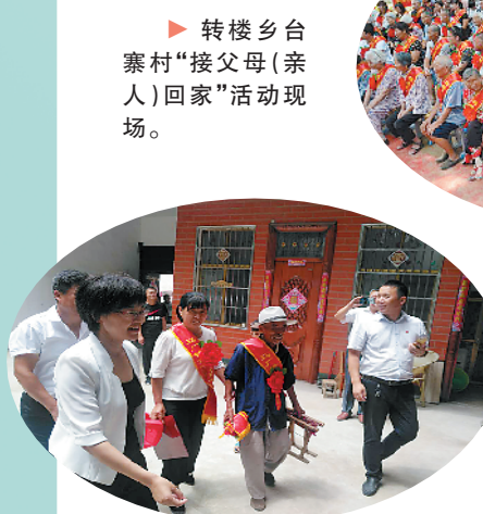
转楼乡台寨村“接父母(亲人)回家”活动现场。