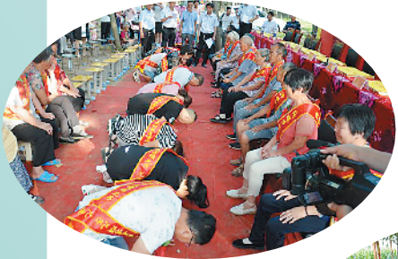
转楼乡褚庄村村民在“接父母(亲人)回家”活动中跪拜父母。