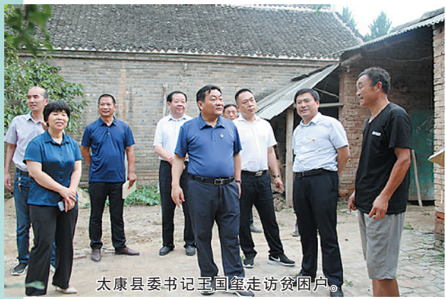
太康县委书记王国玺走访慰问贫困户。

眼下,随着“四养模式”在太康的深入开展,特困老人晚年幸福生活从此有了政策保障,农村特困老人的养老难题也顺利得以破解。“以前孤寡老人贫困户大都生活难以自理,脱贫和养老成为最大难题,‘四养模式’在太康的创新实施,不但让特困群体脱了贫,还实现了老有所养、老有所学、老有所乐、病有所医、弱有所扶。”太康县委书记王国玺认为,“‘四养模式’在太康的成功实践,不仅为全县特困老人晚年幸福‘保驾护航’,也为国人养老提供了‘太康样本’”。