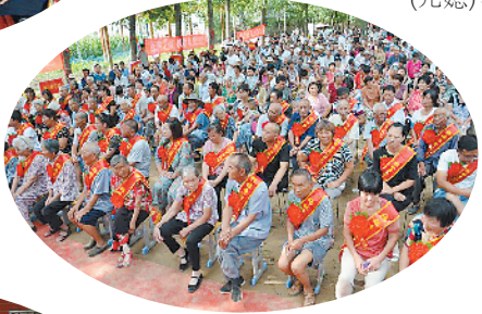
马厂镇“接父母(亲人)回家”活动的一个场景。