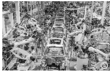
①在位于吉林长春的中车长客股份公司高速动车组装配车间里,几列“复兴号”中国标准动车组正在进行装配(2017年9月14日摄)。