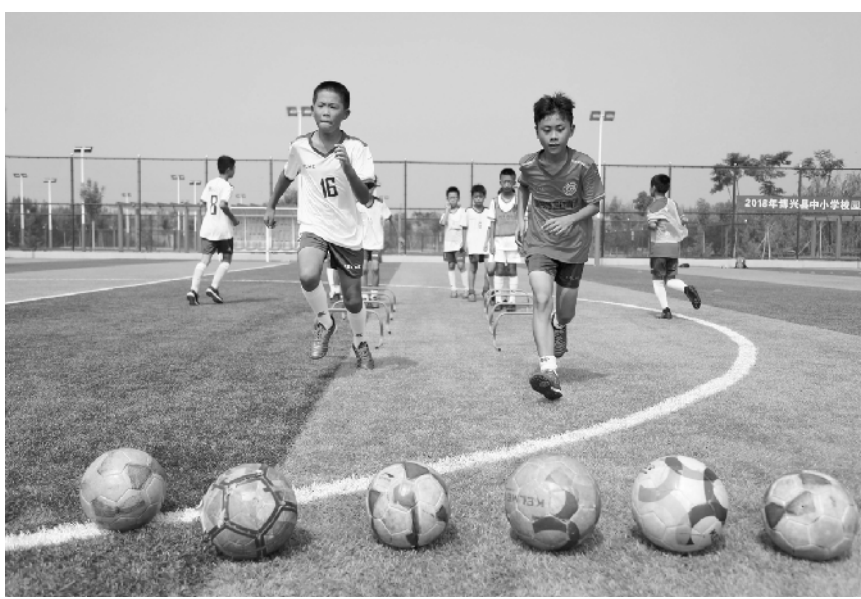
多彩夏令营 暑期添精彩 7月22日,在山东省滨州市博兴县,参加足球夏令营的小学生正在进行足球训练。暑假期间,各地丰富多彩的夏令营活动纷纷开幕。

这位负责人表示,正密切跟踪成品油价格形成机制运行情况,结合国内外石油市场形势变化,进一步予以研究完善。