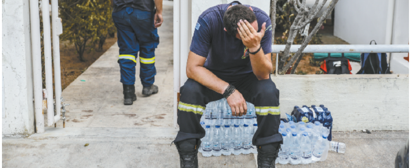
希腊森林火灾遇难人数升至 74 人

到目前为止,气象组织已两次发布关于欧洲干旱和高温的指导说明;6 月底至 7 月初,日本遭遇了数十年来最严重的洪水和山体滑坡;此外,从全球看,今年 6 月在“史上最热 6 月”排名中居第二位。