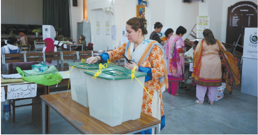
巴基斯坦国民议会选举开始投票

7 月 25 日,在巴基斯坦伊斯兰堡,选民在投票站投票。巴基斯坦国民议会(议会下院)选举于当地时间 25 日上午 8 时正式开始投票,将产生 270 个议席。