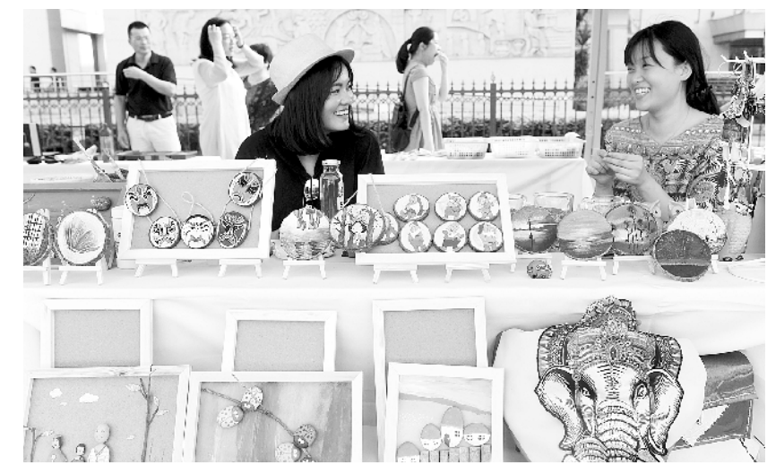
第五届福建文创奖评选活动福州启动

文件，明确今后将重点发展节能环保、清洁生产、清洁能源、循环农业、中医药、文化旅游、通道物流、军民融合、数字经济、先进制造等十大类绿色生态产业，并确定了265个、总投资达8200多亿元的绿色生态产业重点项目。 按照规划，到2020年，甘肃省将借助十大类绿色生态产业使产业结构调整取得较大进展，生态文明体制改革取得重大突破，生态产业体系初步形成，最终使绿色产业成为全省经济的重要增长极。