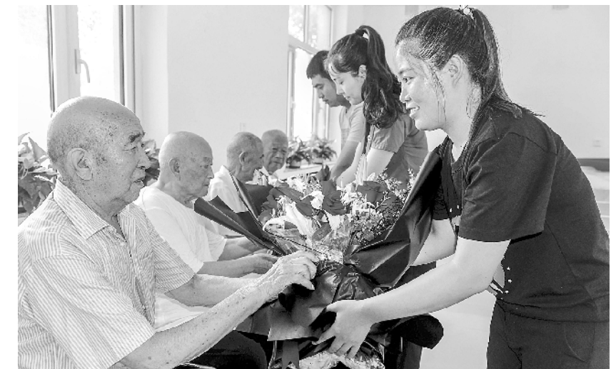
河北阜城：青年党员开展迎“八一”活动

展合作办学、联合招生和设立校外教学点(班)学校的审核、备案、管理和指导工作；要求开展联合招生、合作办学和校外教学点(班)的中等职业学校切实履行主体责任，校长是“第一责任人”，分管校长是“直接责任人”，具体负责人是“具体责任人”。 2018年起，河南省教育厅将适时开展中等职业学校联合招生、合作办学和设立校外教学点(班)备案和管理情况的调研和复查工作，对违反“十个禁止”行为或其他违规办学行为的学校，将严肃处理、严厉追责。