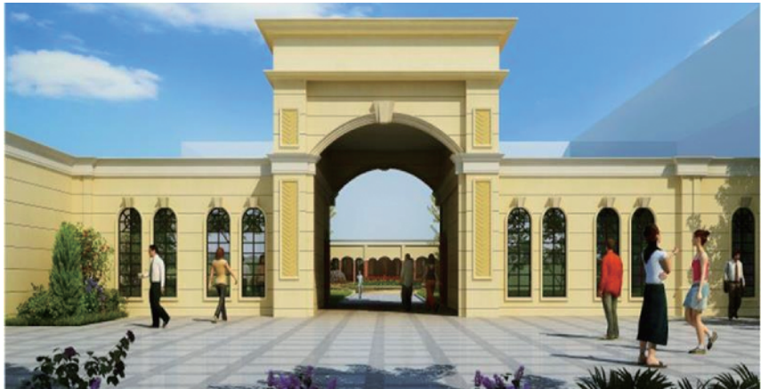
“李国有实验班”效果图

凌晨,当豫东大地的周口市还在沉睡的时候,这个学校最先醒来了。一年四季,春夏秋冬,每学期的每一天,这个学校都是这座城市最先醒来的地方,学校的万名师生像是报晓的雄鸡,每天迎着第一缕阳光,开始紧张有序的学习生活。