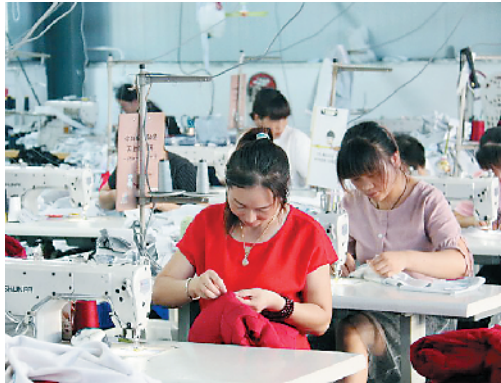
红花集镇杜岗村扶贫车间

点评:党旗飘扬事业兴,党员带头立新功;红色教育不放松,升升初心得始终;党建效果何处理,各项事业红彤彤。