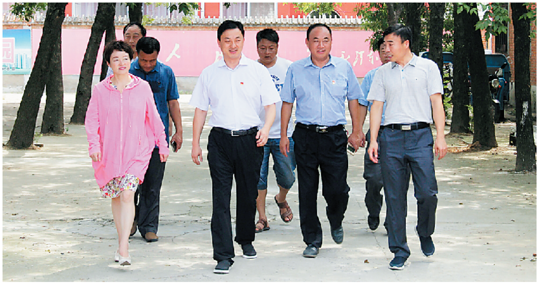
县委书记林鸿嘉到红花集镇龙池头村走访慰问贫困户