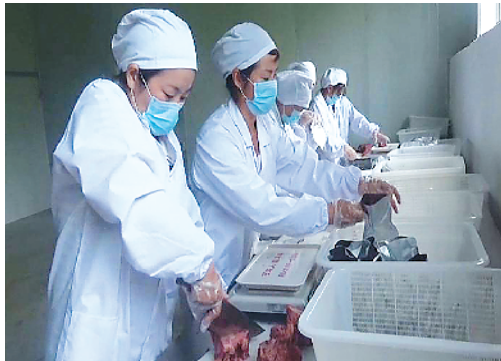
红花集镇纪庄村扶贫车间