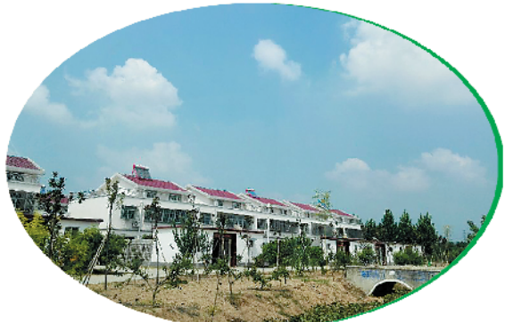
红花集镇龙池头村一角