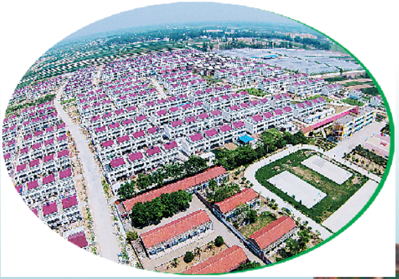
红花集镇龙池头村航拍图