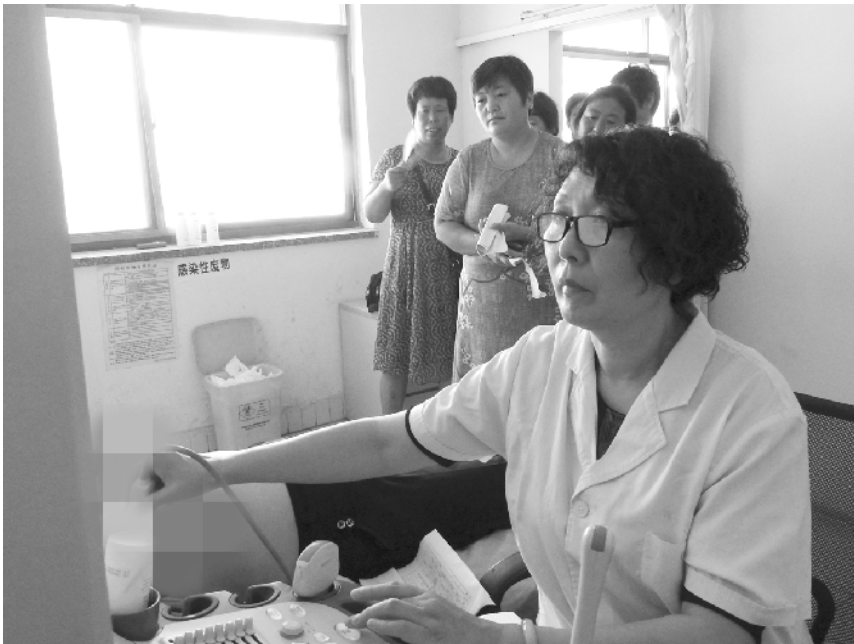
为提升妇女健康水平,实现宫颈癌、乳腺癌早诊断、早发现、早预防、早治疗,近日,川汇区妇幼保健院大力开展“两癌”免费筛查工作。图为该院一名医生正在为适龄妇女做乳腺癌筛查。