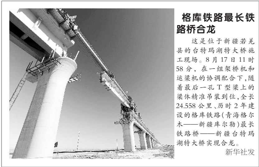
格库铁路最长铁路桥合龙

已进一步安排部署防汛防风工作，启动防汛Ⅲ级应急响应，并派出6个工作组，分赴受台风影响的地区督促指导防汛防风工作。河南省防汛抗旱指挥部要求各地切实有效防范洪涝灾害，确保度汛安全，全力实现“确保人民群众生命财产安全，不发生江河决堤、不发生水库垮坝、不发生城市受淹”的目标。 目前，河南省主要河道水势平稳，大中小型水库运行正常。河南省气象台预计，19日白天河南省北部还将有大到暴雨，局部大暴雨，强降雨中心将于19日夜间移出河南省。