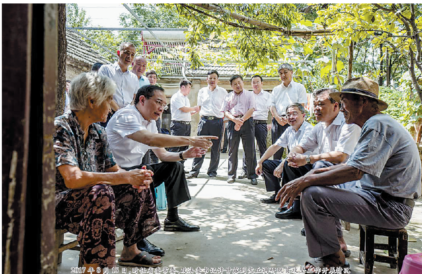
2017年8月15日,时任省委书记、省长陈润儿到沈丘调研脱贫攻坚工作并开展调研。