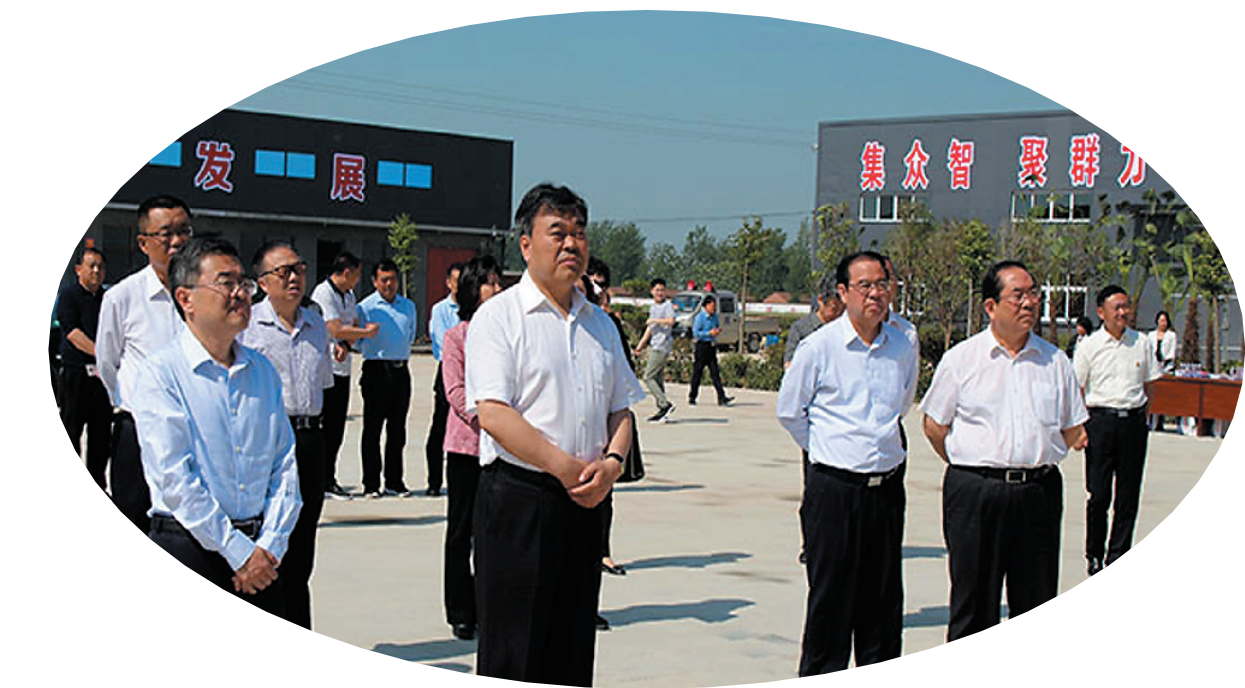
市委书记刘继标、市长丁福浩在沈丘调研扶贫车间开展情况。