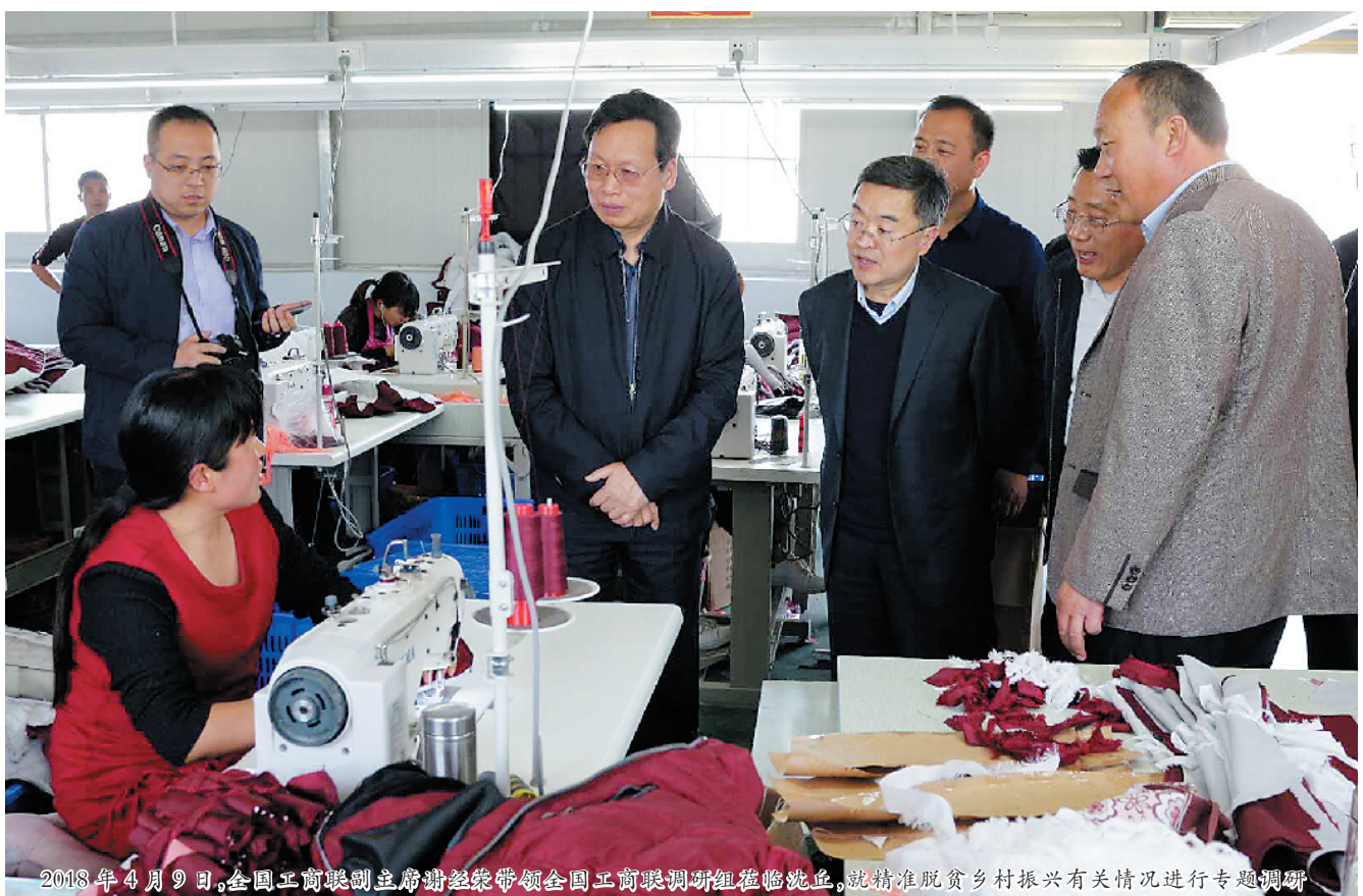
2018年4月9日,全国工商联副主席谢经荣到沈丘调研脱贫攻坚工作,就精准扶贫有关情况进行专题调研。