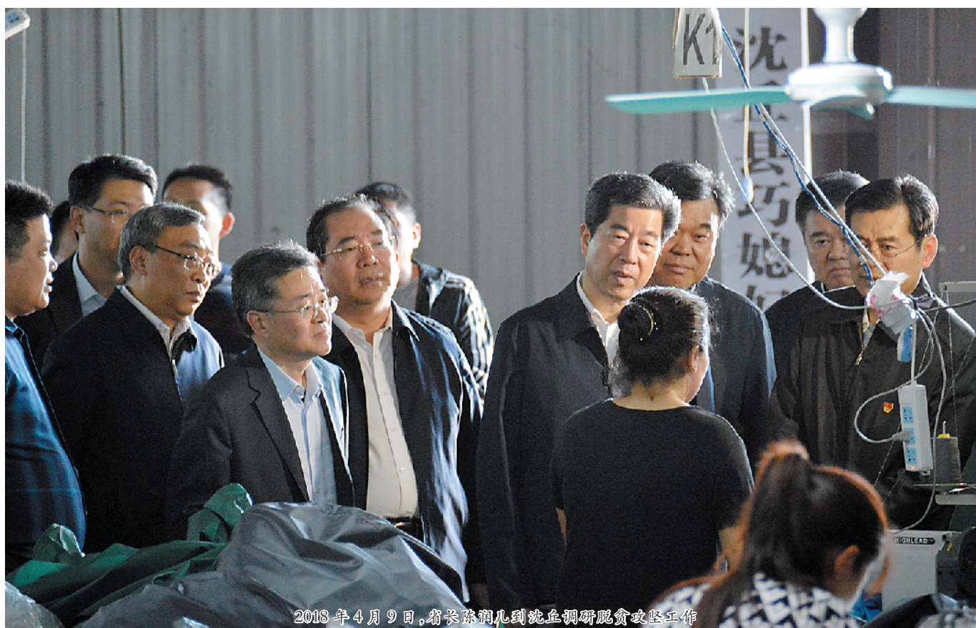
2018年4月9日,省长陈润儿到沈丘调研脱贫攻坚工作。