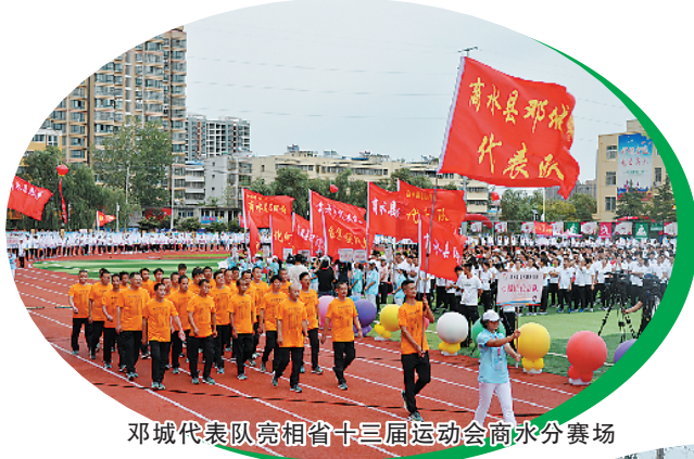
邓城代表队亮相省十三届运动会商水分会场