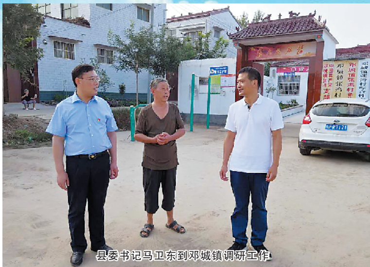
县委书记马卫东到邓城镇调研工作

站在新起点,谋求新发展,实现新突破,是全镇人民的共同期盼,更是邓城镇党委、镇政府的光荣使命和神圣职责。该镇决心在县委、县政府的坚强领导下,举全镇之力,汇干部之心,融民心之情,凝聚全镇人民的智慧和力量,攻坚克难,开拓创新,为建设富强、和谐、幸福邓城而努力奋斗! ①9