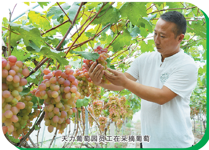
天力葡萄园员工在采摘葡萄