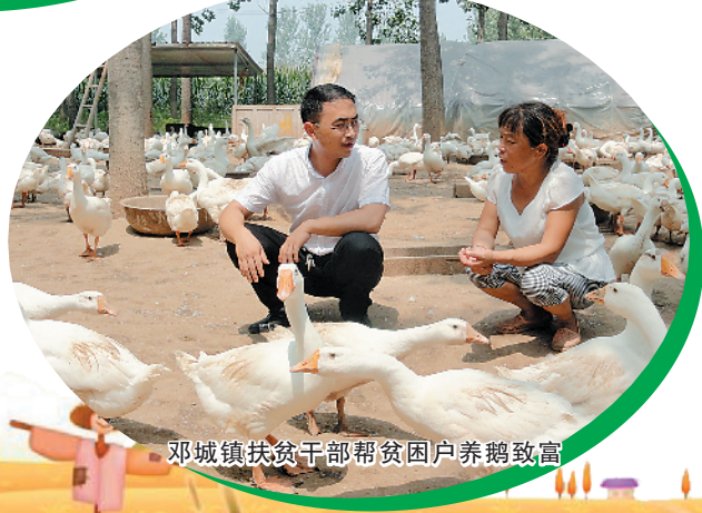
邓城镇扶贫干部帮贫困户养鹅致富