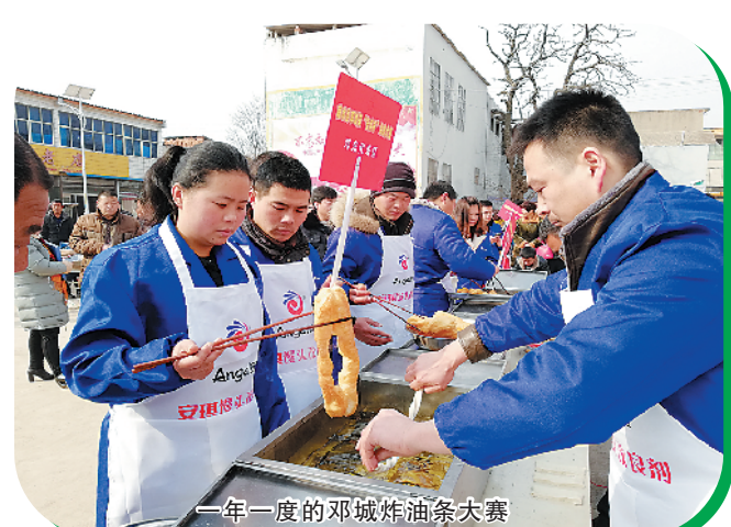
一年一度的邓城炸油条大赛