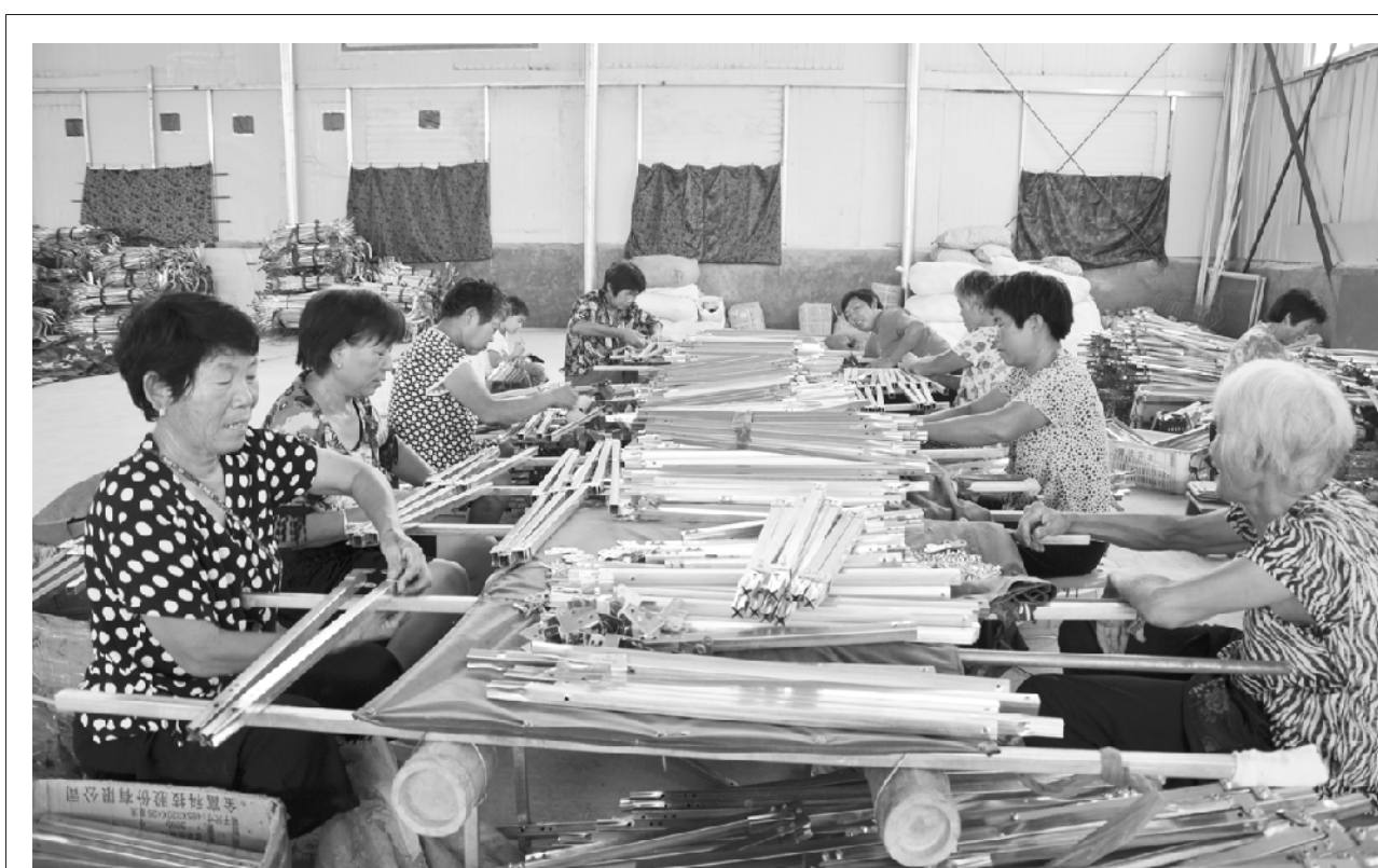
扶贫企业带动贫困户就业

商水县积极培育和发展乡镇扶贫带贫企业,帮助贫困户就近打工脱贫致富,目前,全县已经在乡镇村发展小微型服装生产、渔网制作、种植养殖、玩具加工等扶贫企业1700多家,让20多万农民在家门口实现就业。图为大武乡留守妇女在村头“喜洋洋”车蓬厂组装三轮车蓬架。