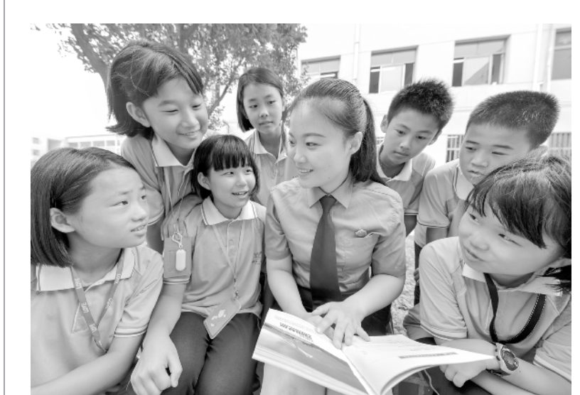
开学第一课 法制安全进校园

据了解,作为首批5G规模试点地区,湖北正大力布局5G网络,推进5G规模试验,拓展5G在工业互联网、物联网、车联网等领域的应用。到今年年底,湖北移动预计将建成不少于100个5G基站,实现规模组网,完成技术测试任务。