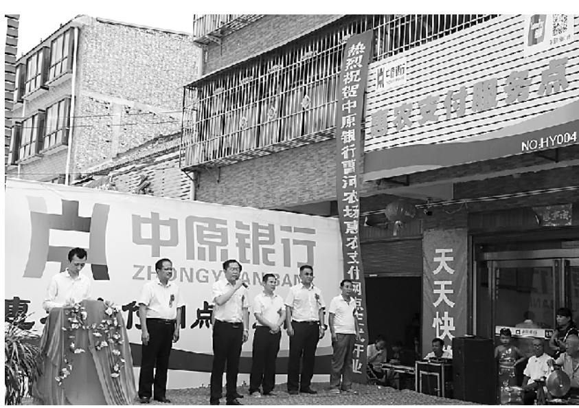
图为揭牌仪式现场。

作为金融服务“乡邻小站”,惠农支付服务点的主要功能是为广大农村客户提供助农取款、支付结算、余额