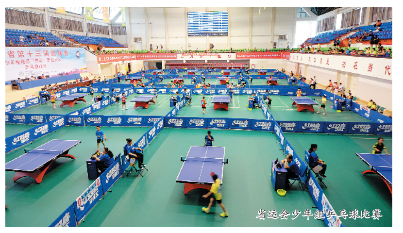
省运会青少年组乒乓球比赛