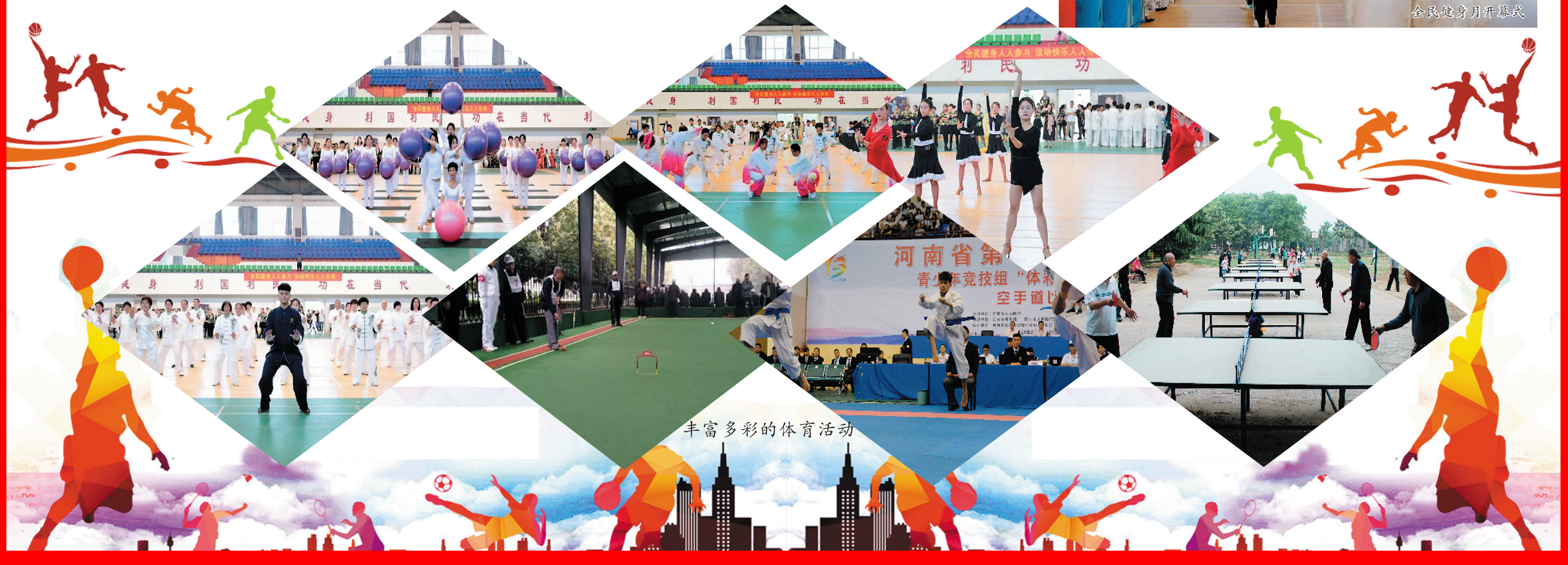
丰富多彩的体育活动