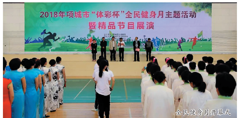
全民健身月开幕式