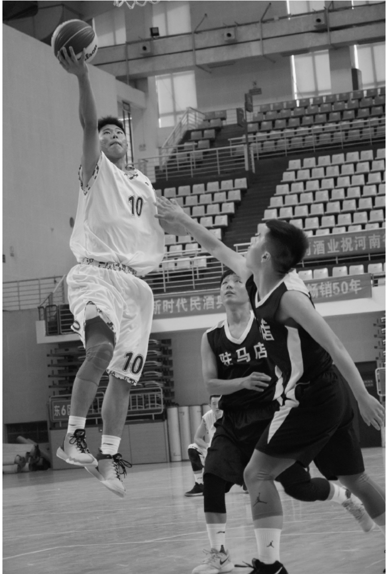
焦作队对阵驻马店队。

在第一轮男甲 A 组比赛中，第二场比赛是新乡队对决南阳队，新乡队以 7:21 的比分败给南阳队。第三场比赛是东道主周口队对阵漯河队，因漯河队弃权，周口队直接胜出，迎战第二轮的小组赛。②8