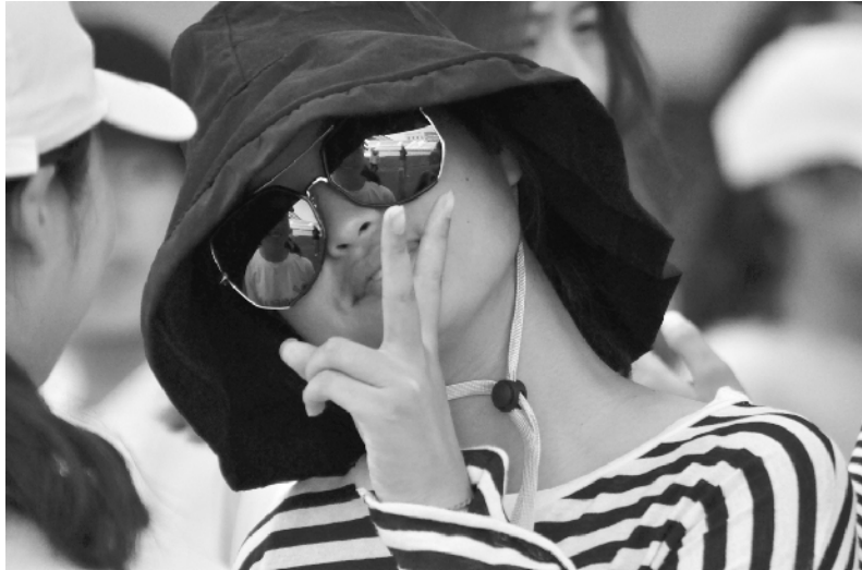
精彩省运，来张自拍