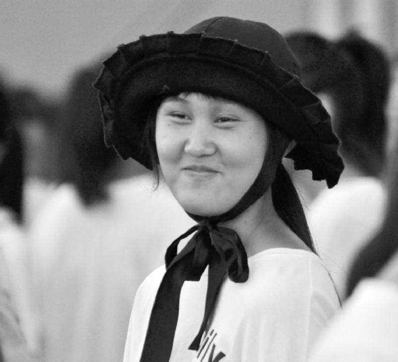
累并快乐着的方阵演员