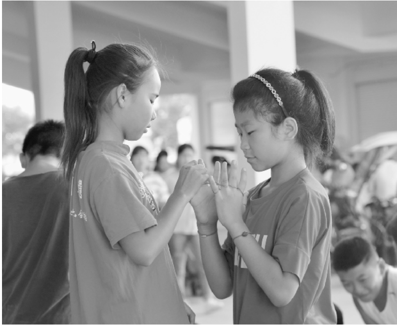
排练间隙，自娱自乐