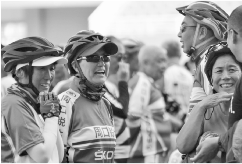
全副武装的女骑手