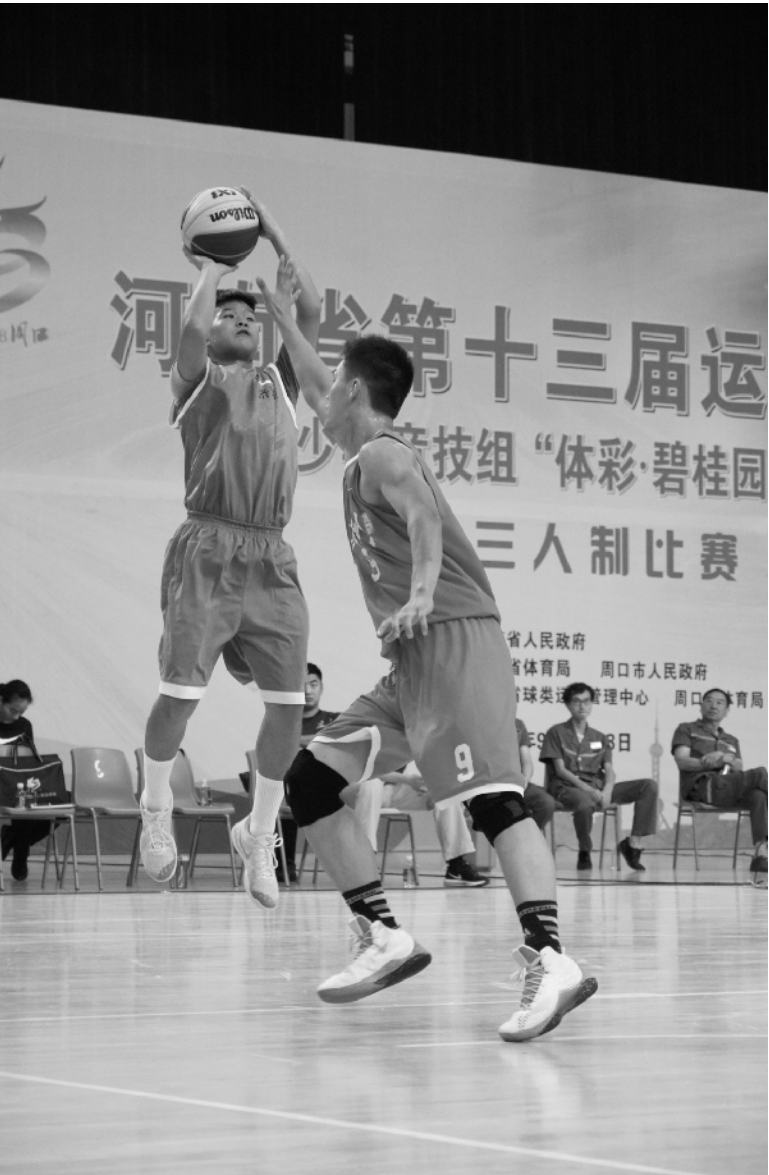
郑州队与济源队交锋。