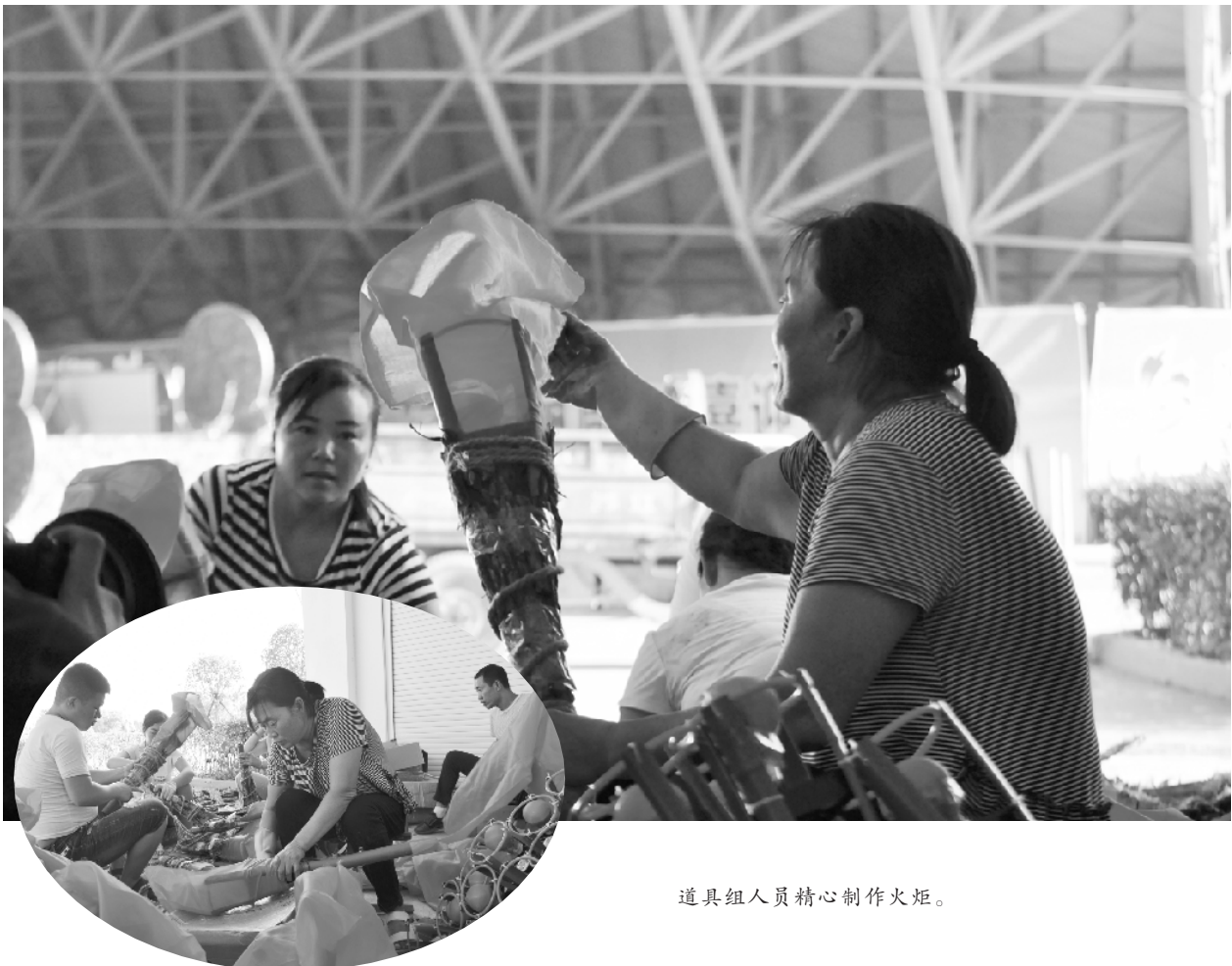
道具组人员精心制作火炬。

红彤彤的凌布在电扇的吹动下，映着红色的灯光，如跳跃燃烧的火焰，格外漂亮……9月5日，在省运会开幕式道具制作现场，工人们正在争分夺秒地赶制八百把火炬。