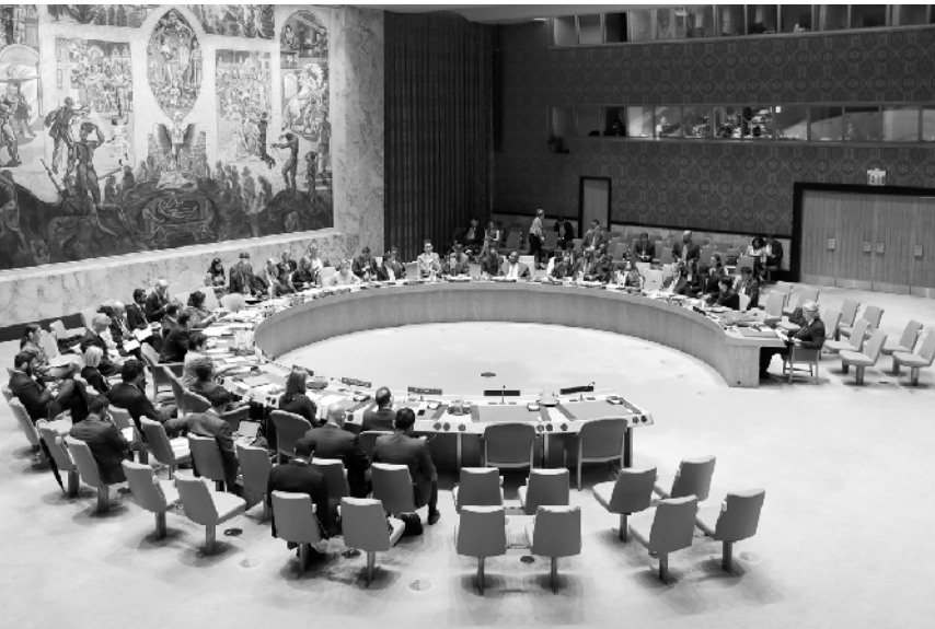
联合国秘书长呼吁打击腐败 9 月 10 日,在位于纽约的联合国总部,安理会举行关于腐败与武装冲突的辩论会。当日,联合国秘书长古特雷斯在安理会关于腐败与武装冲突的辩论会上发言,呼吁各国切实采取措施打击腐败。 新华社发

河南省纪委监委相关负责人介绍,河南省纪委监委还制定了督导评价细则,在全省纪检监察机关部署开展了专项督查活动,推动扫黑除恶专项斗争深入推进。“针对中央巡视组反馈的‘有的干部充当黑恶势力保护伞’问题,我们研究制定了具体整改措施,正在全力抓好落实。”