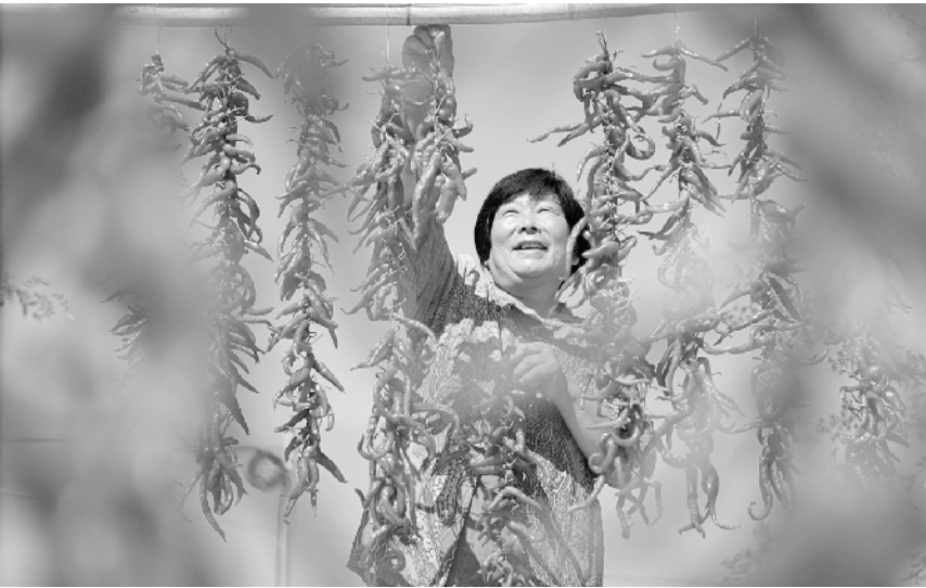
金秋农事忙 9 月 11 日,山东省淄博市沂源县东里镇东村的农民在晾晒辣椒。金秋时节,各地农民忙着田管、收获、晾晒农作物等,田间地头、农家院落处处可见一派繁忙景象。