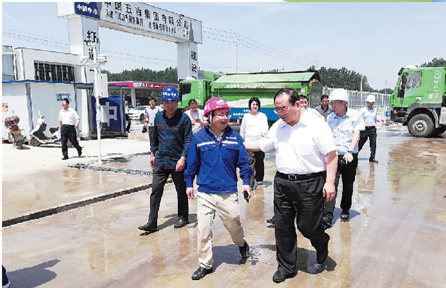
市长丁福浩到金海嘉苑A区指导工作

“中州杯”奖是河南省建设行业工程质量最高荣誉奖,“中州杯”奖的评选对象为建筑施工企业在河南省范围内承包或河南省建筑施工企业在省外承包并已经建成使用的各类工程。