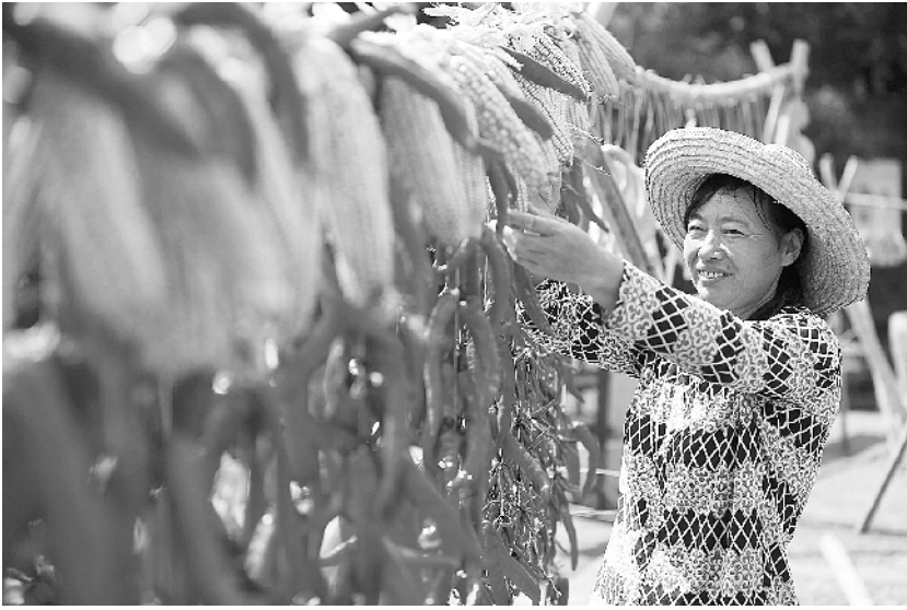
安徽黄山:古村晒秋乐丰收

据了解,第21届全国推广普通话宣传周的主题是:说好普通话,迈进新时代。宣传周期间和前后,各地将通过宣传海报、公益广告等形式宣传推广普通话。天津、上海、江西、辽宁、西藏等地还将启动社会人员普通话水平测试基地,举办“中国诗词文赋”大赛、留学生中国诗文诵读大会、学生阅读大会、大学生普通话演讲比赛、中小学学生语言文字应用能力集中展示等活动。