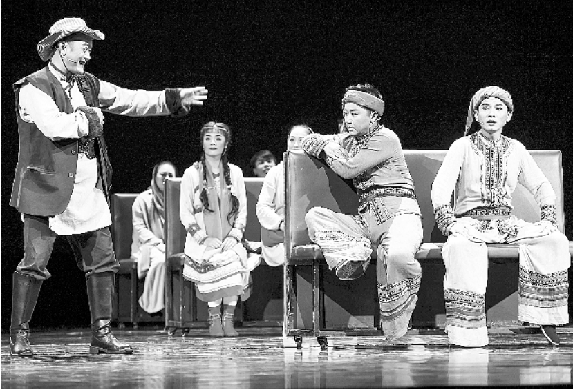
《绿皮火车》驶进丝路国际艺术节

相同主题的另一本《光影力量:中国村镇40年变迁》一书,也于近日由新华出版社出版发行。