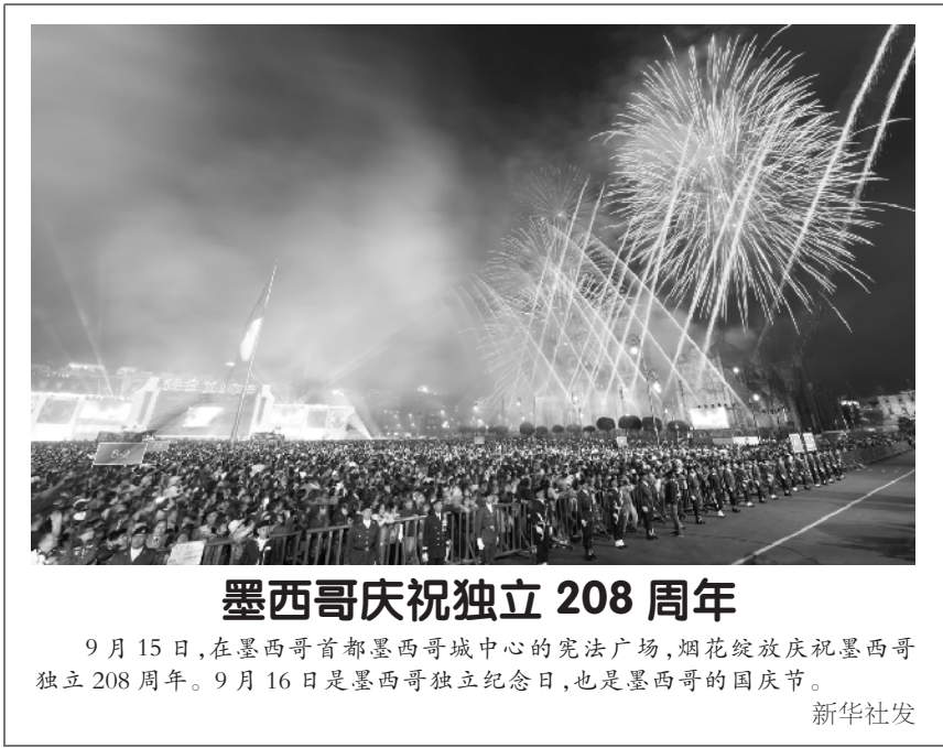
墨西哥庆祝独立 208 周年 9 月 15 日，在墨西哥首都墨西哥城中心的宪法广场，烟花绽放庆祝墨西哥独立 208 周年。9 月 16 日是墨西哥独立纪念日，也是墨西哥的国庆节。

北京城市副中心启动海绵城市改造项目 据新华社北京 9 月 16 日电（记者桂壮峰）记者从北京市通州区海绵城市建设领导小组办公室了解到，作为全国第二批海绵城市建设试点城市，通州区海绵城市改造不断加速，近期 20 余个改造项目已全面启动。预计年底前，改造项目 75% 的雨水径流将会就地消纳和利用。 2016 年，通州区被确定为全国第二批海绵城市建设试点，试点总规划面积 19.36 平方公里，西南起北运河，东至规划的春宜路，北至运潮减河。在此范围内的住宅小区、公共建筑、公园绿地、市政道路、河道将根据建设需求逐步进行相关改造。海绵城市建设内容包括人行道透水铺装、停车位透水铺装、雨水调蓄池、下凹绿地、植草沟、渗渠等景观设施。 今年年底前，通州试点改造区域的年径流总量控制率将达到 75%，也就是年均总降雨量 75% 的雨水不会形成径流，实现小雨不积水、大雨不内涝的海绵城市建设目标。 根据计划，2020 年，通州区 20% 建成区的面积将达到海绵城市建设要求；2030 年，通州区 80% 建成区的面积将达到海绵城市建设要求，最终成为小雨不积水、大雨不内涝、水体不黑臭、热岛效应有所缓解的具有较高“海绵度”的生态宜居城市。