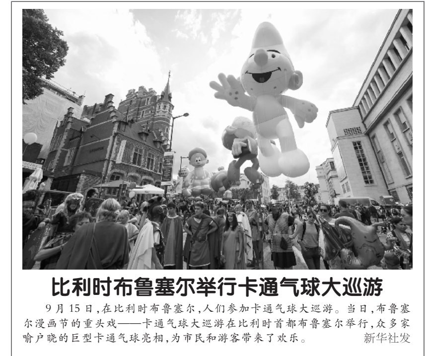
比利时布鲁塞尔举行卡通气球大巡游 9 月 15 日，在比利时布鲁塞尔，人们参加卡通气球大巡游。当日，布鲁塞尔漫画节的重头戏——卡通气球大巡游在比利时首都布鲁塞尔举行，众多家喻户晓的巨型卡通气球亮相，为市民和游客带来了欢乐。

华盛顿华侨华人观影纪念“九一八”事变 新华社华盛顿 9 月 15 日电（记者徐剑梅）15 日在美国首都华盛顿特区西北部的阿瓦隆剧院，约 300 名华侨华人观看了讲述中国幸存“慰安妇”生活的纪实电影《二十二》，以此纪念“九一八”事变 87 周年。 电影以平等和尊重的视角讲述 22 名幸存“慰安妇”的境遇，以看似平淡琐碎的对话和细节，一点一滴呈现她们蒙受的苦难以及晚年生活。影片中，每一位受害者不再只是一个名字、一张照片，而是一个有性格、有感情、有尊严的人。 活动组织者之一、华府亚太二战浩劫纪念会会长陈壮飞观影后心情沉重地对新华社记者说，“慰安妇”受了太多苦，幸存者有的不能生育，有的落下残疾，很多人孤独终老。 “日本政府应该正式出面道歉，还她们一个公道，还她们尊严。”陈壮飞说。 据中国慰安妇问题研究中心统计，第二次世界大战期间，有约 40 万亚洲女性沦为日军“慰安妇”，其中包括逾 20 万名中国女性，她们饱受凌辱和摧残。 当天观影活动由华府亚太二战浩劫纪念会主办，美京华人活动中心、华盛顿诺亚中心、华府地区北京大学校友会等多家华人团体协办。此前，这些华人团体还举办了纪念“九一八”专题讲座和抗战史实照片展览。