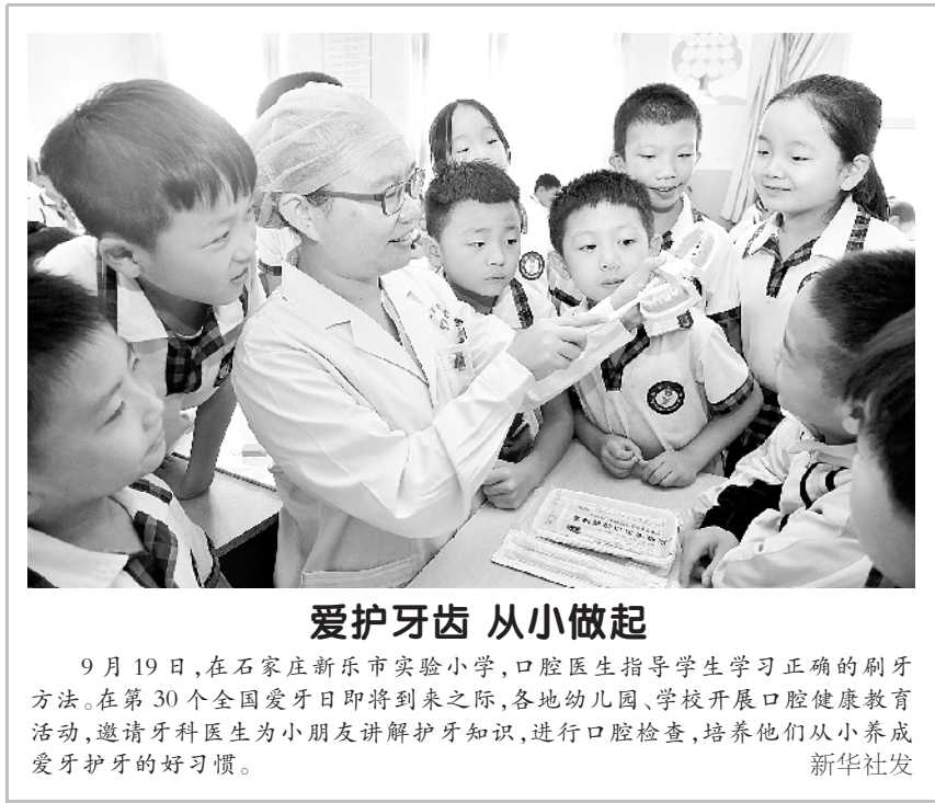
爱护牙齿 从小做起 9 月 19 日，在石家庄新乐市实验小学，口腔医生指导学生学习正确的刷牙方法。在第 30 个全国爱牙日即将到来之际，各地幼儿园、学校开展口腔健康教育活

和平之可贵，中国坚定不移走和平发展道路，永远是世界和平的建设者、全球发展的贡献者、国际秩序的维护者。 习近平强调，国际和平日纪念活动设立以来，致力于传播和平理念、维护世界和平，已成为各方加强安全治理合作、凝聚国际和平力量的重要平台。今年的纪念活动以“推动构建人类命运共