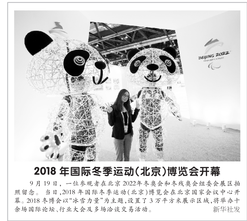
2018 年国际冬季运动(北京)博览会开幕 9 月 19 日，一位参观者在北京 2022 年冬奥会和冬残奥会组委会展区拍照留念。当日，2018 年国际冬季运动(北京)博览会在北京国家会议中心开幕。2018 冬博会以“冰雪力量”为主题，设置了 3 万平方米展示区域，将举办十余场国际论坛、行业大会及多场洽谈交易活动。

新华社北京 9 月 19 日电（记者 施雨岑）由中国人权研究会、中国人权发展基金会联合主办的“2018·北京人权论坛”19 日在京闭幕。 本届论坛以“消除贫困：共建一个没有贫困、共同发展的人类命运共同体”为主题，并设置 4 个分论坛，主题分别是：消除贫困与生存权发展权的实现，中国的扶贫理念、成就、经验的人权意义，减贫的国际合作与人权保障，构建人类命运共同体与人权保障。 来自近 50 个国家、地区和国际组织的官员、专家学者、知名人士等 200 余人出席本届论坛。在 2 天时间里，他们围绕论坛主题畅所欲言、自由交流，通过大会发言、分论坛讨论等多种方式进行沟通和研讨。 19 日下午，与会嘉宾还集体参观考察了位于北京市怀柔区西北部的北沟村，详细了解该村近年来脱贫减贫的成就和经验。 自 2008 年举办以来，“北京人权论坛”已成功举办 9 届，成为人权领域开展交流对话、促进务实合作的重要平台，也形成了一系列思想共识，为丰富人权的实践提供了有力支撑。