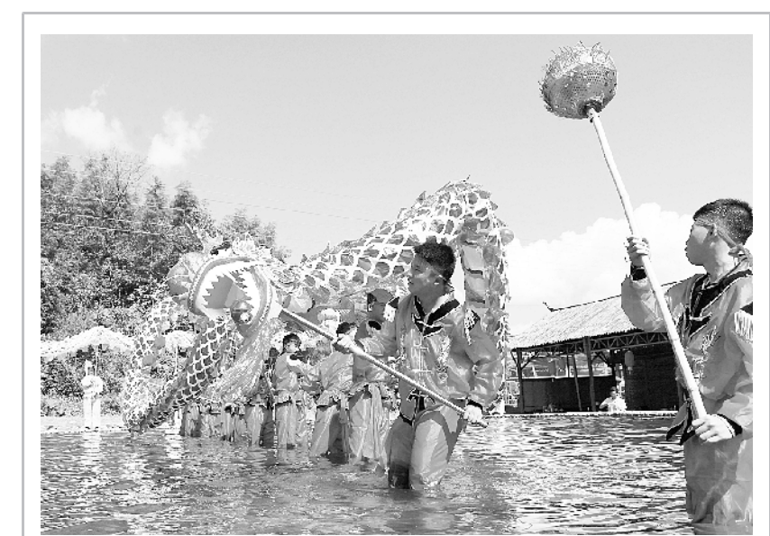
江西萍乡举办首个“中国农民丰收节”主题活动 9 月 19 日，在江西萍乡举办的首个“中国农民丰收节”主题活动中，人们表演舞龙闹丰收。在首个“中国农民丰收节”即将到来之际，江西萍乡举办主题活动，传统祭祀、唢呐表演、舞龙闹丰收等民俗活动轮番上演，农民们载歌载舞欢庆丰收。

新华社北京 9 月 19 日电（记者 姜琳）为进一步提升电动汽车充电便利，国家电网公司 19 日宣布，其下属智慧车联网平台与南方电网智能充电服务联通。至此，我国电动汽车充电服务全面实现互联互通，我国主要的 20 家充电运营商、超过 25 万个充电桩均接入“一张网”，为 200 多万辆电动汽车提供“一站式”服务。 为实测充电设施“南北互通”的便捷性和可靠性，国家电网下属电动汽车服务公司和南方电网广州供电局近日进行了“电动汽车京广行”活动。8 辆电动汽车从广州出发途经 19 个城市，于 19 日抵达北京，行驶距离 3200 公里。 “未来我们将继续加快公共充电网络建设，建成覆盖京津冀鲁、长三角地区所有城市及其他地区主要城市的公共充电网络，实现高速公路快充网络中东部城市全覆盖。”国网电动汽车服务有限公司董事长江冰说。 我国是全球最大的电动汽车销售市场，但“难充电、难跑远”一直广为消费者“吐槽”。造成这一问题的一个重要原因，就是充电桩运营商“各搞一摊、彼此不通”。2017 年以来，我国大力推进充电设施建设和企业互联互通，相关问题得到大幅缓解。 以国家电网为例，截至目前，已建设公共充电桩近 6 万个，覆盖 23 个省份、152 个城市；其下属智慧车联网平台累计注册用户超过 110 万人，是全球接入充电桩数量最多、覆盖范围最广的电动汽车服务平台。 据介绍，智慧车联网平台建立了充电桩线上实时监控体系，提供 7×24 小时全天候在线客服服务，可实现城市内一小时赶到现场，高速服务区两小时赶到现场。