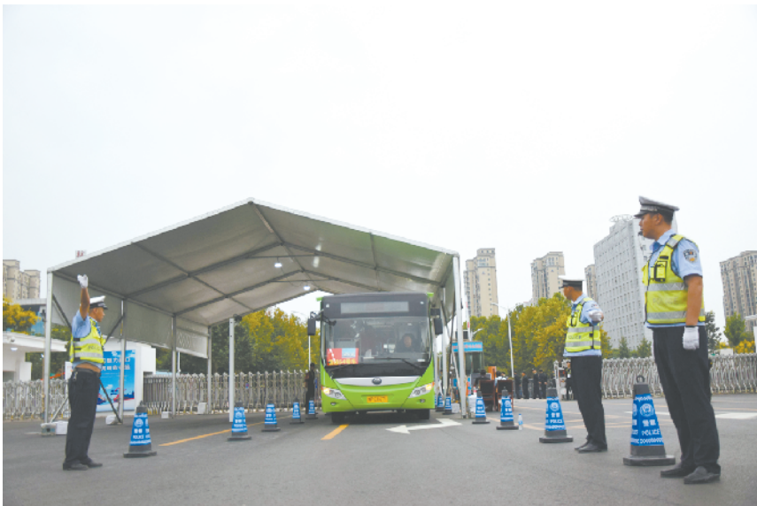
交警部门有序引导