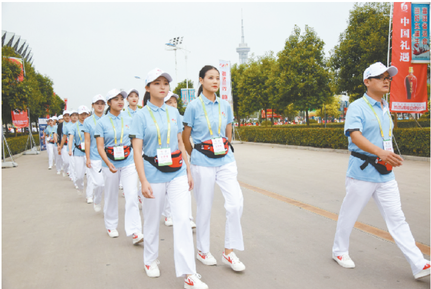
朝气蓬勃的志愿者