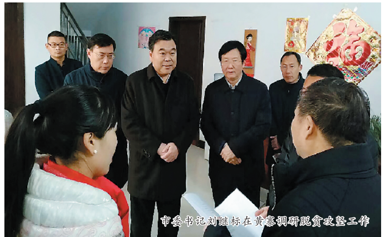
市委书记刘国栋在黄寨调研脱贫攻坚工作