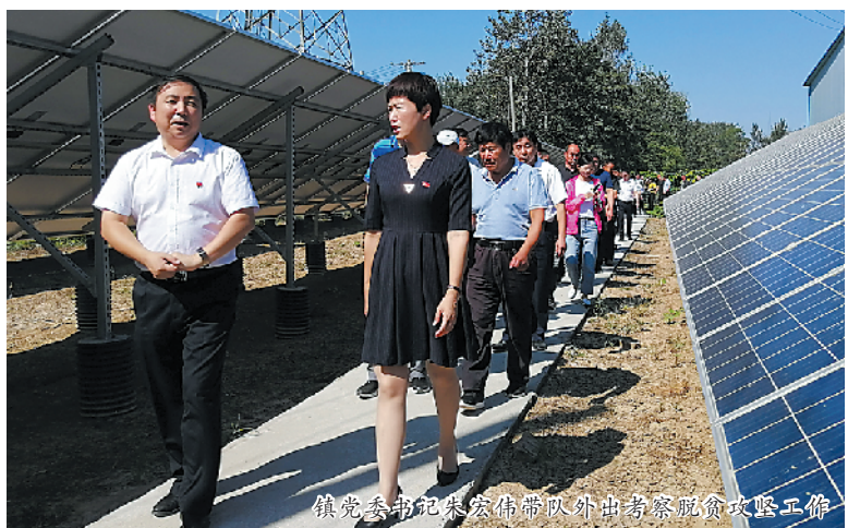
镇党委书记朱宏伟带领外出考察脱贫攻坚工作