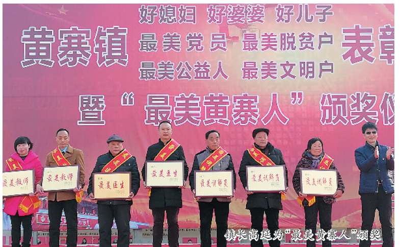
镇长高延均“最美黄寨人”颁奖