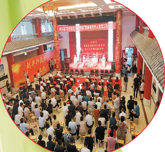
全县“孝善敬老 接受回家”现场会在黄寨举行