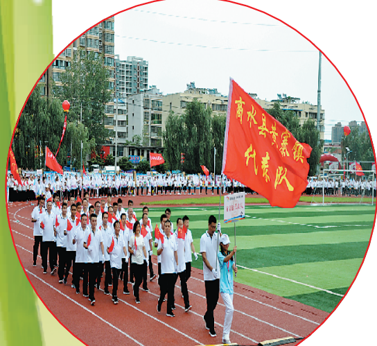
参加省运会商水分赛场开幕式