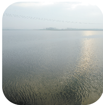
引黄调蓄工程湖面