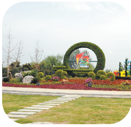
文昌大道景观节点